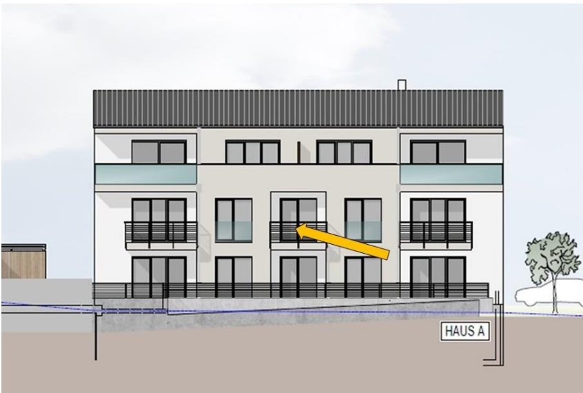
Haus A - Wohnung A05