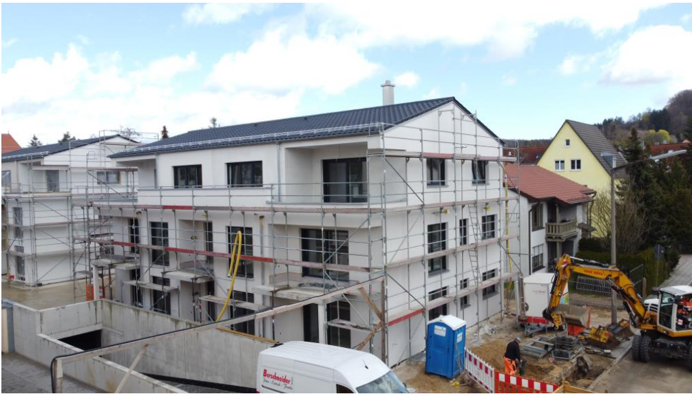
Einzug Juli 2023