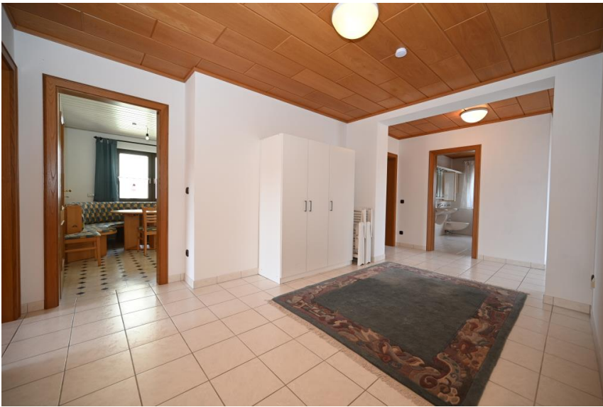
Wohnung 2 im 1. OG