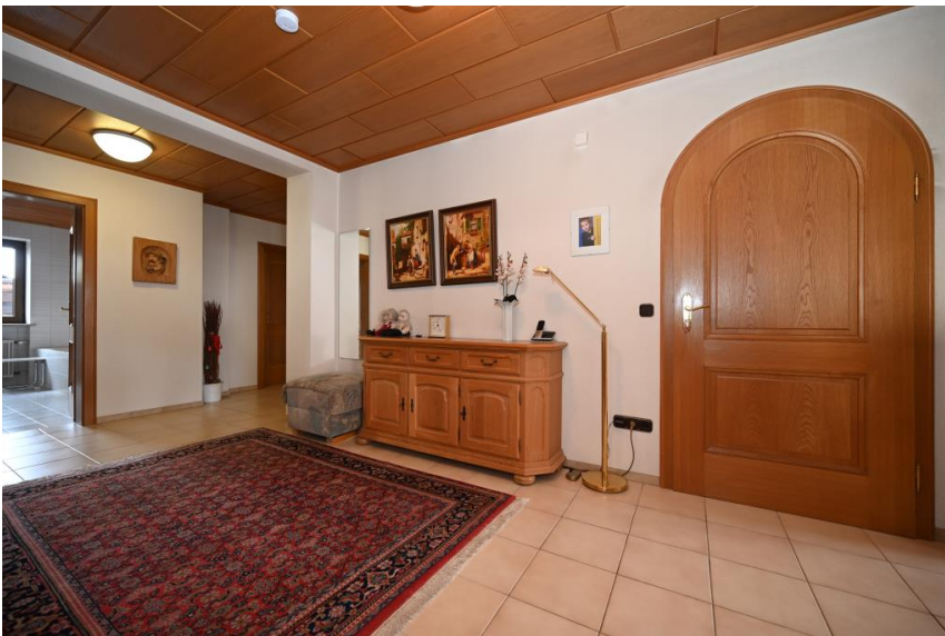
Wohnung 1 im EG