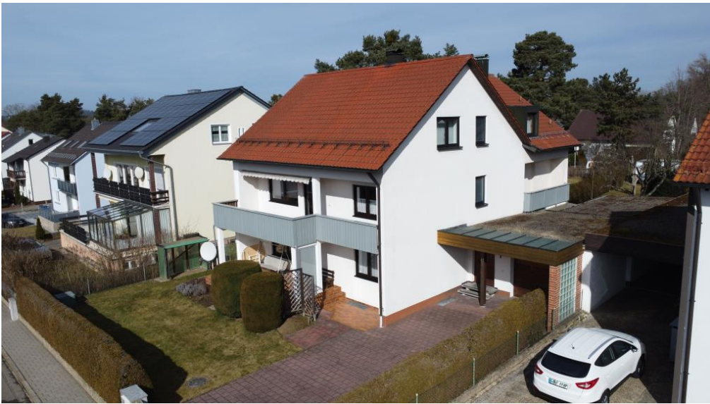
3 familienfreundliche Wohnungen