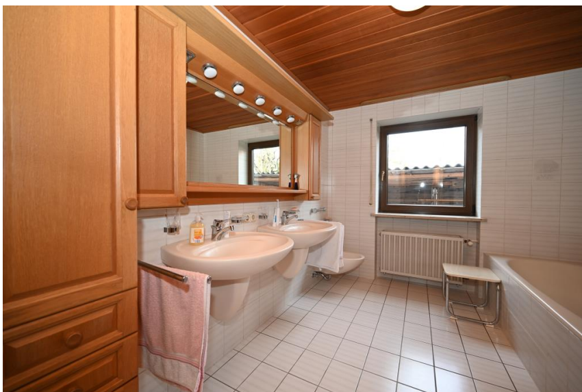
Badezimmer in Vollaussattung