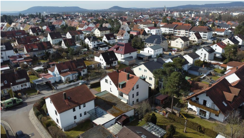
In gefragter Lage