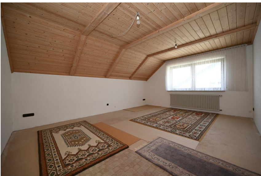
Wohnung 3 im DG