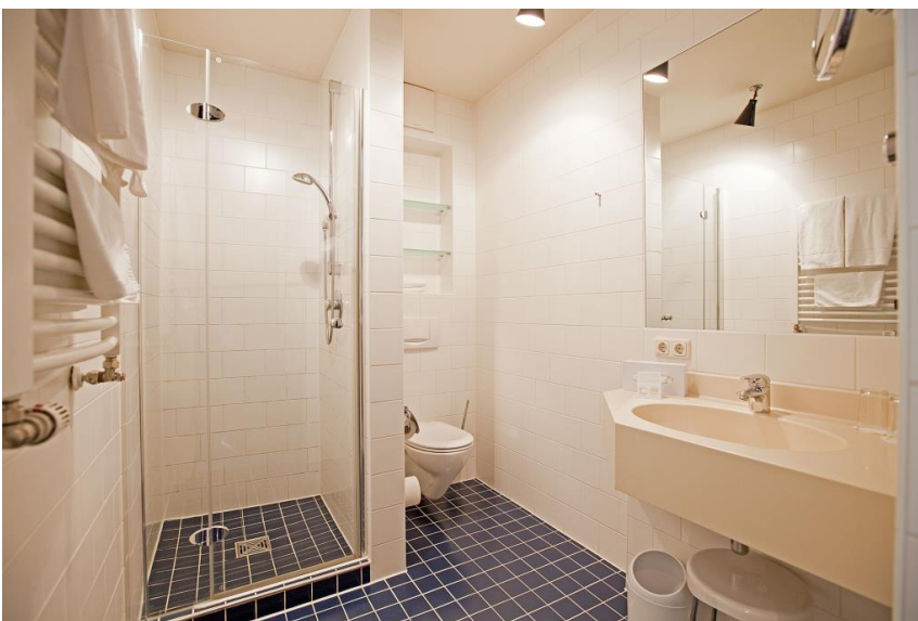
Bad Doppelzimmer Superior