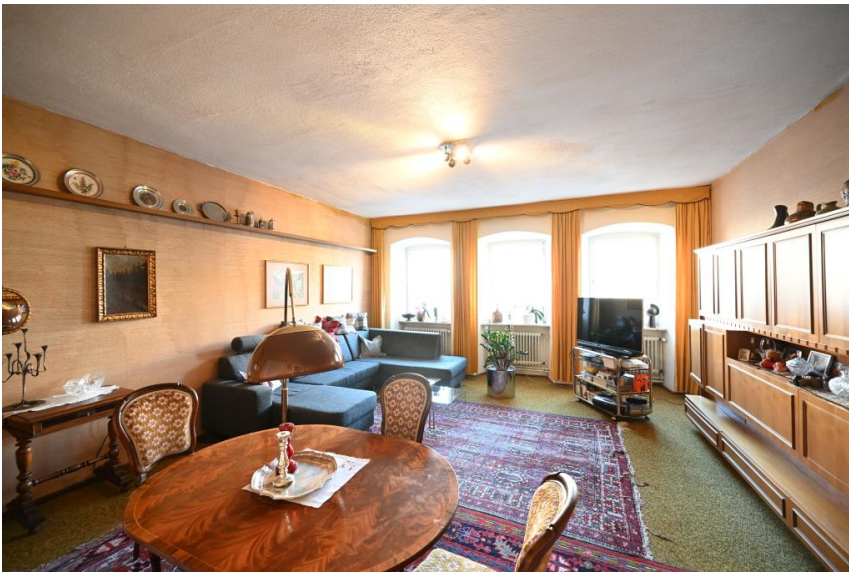
Wohnung im 1.OG