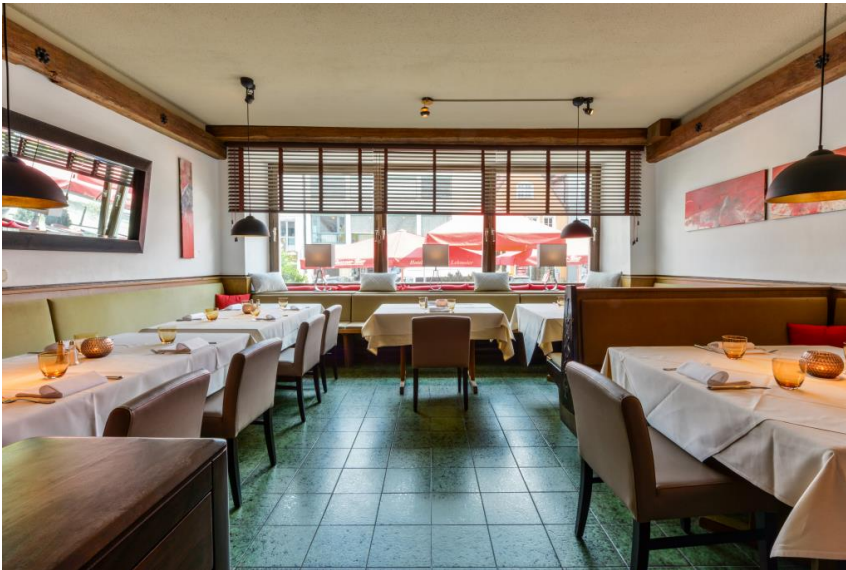
Hell & gastfreundlich