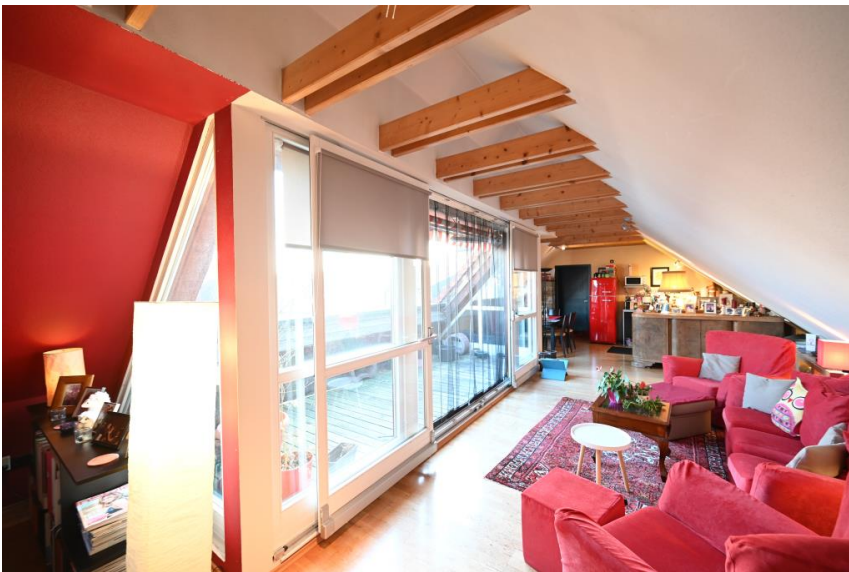
Wohnung im DG