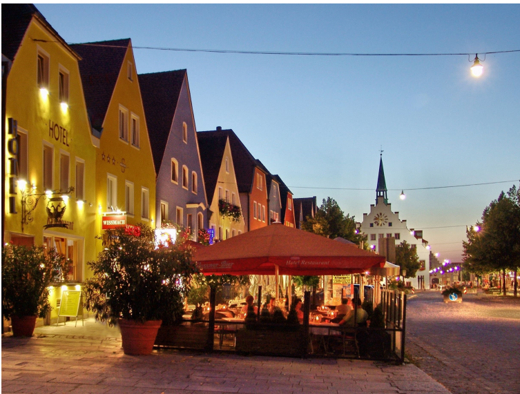
Ein Juwel an der Marktstraße