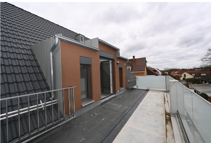
Traumhaft! Geräumige Dachterrasse