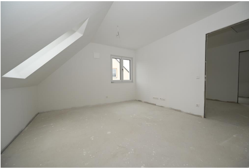
Böden selbst bemustern