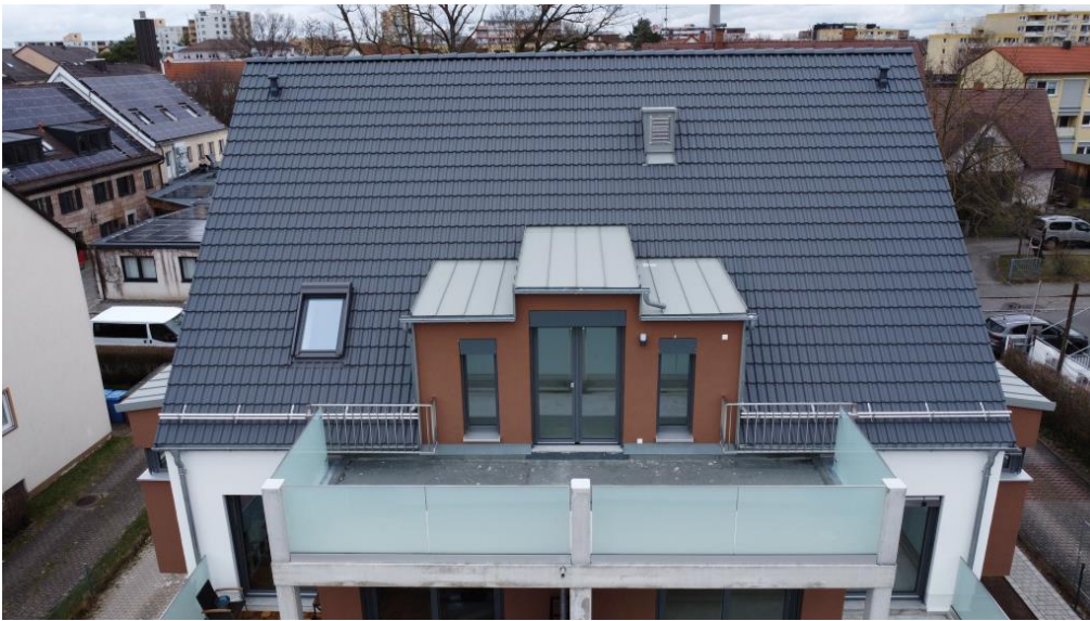
Alleine auf einer Ebene