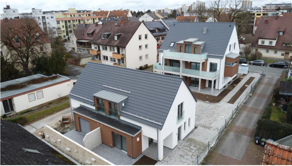
Attraktive, zeitlose Architektur