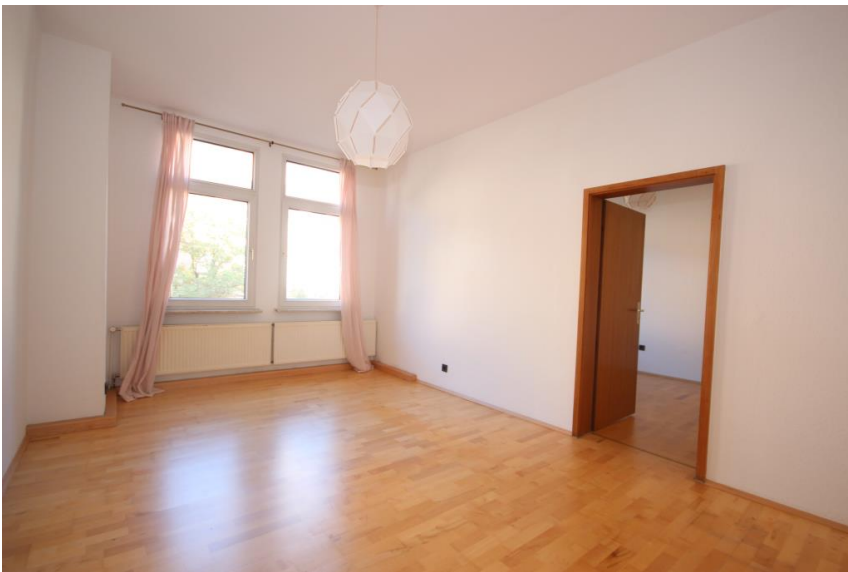
Wohnen mit Parkett