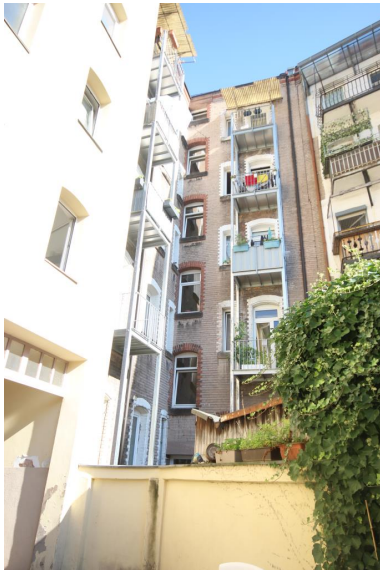
Balkon zum Innenhof