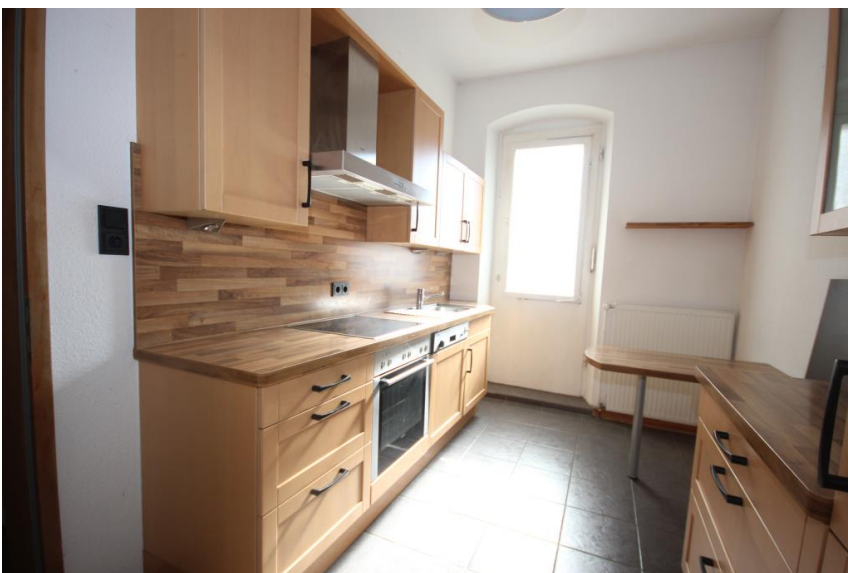
Großzügige Küche inklusive