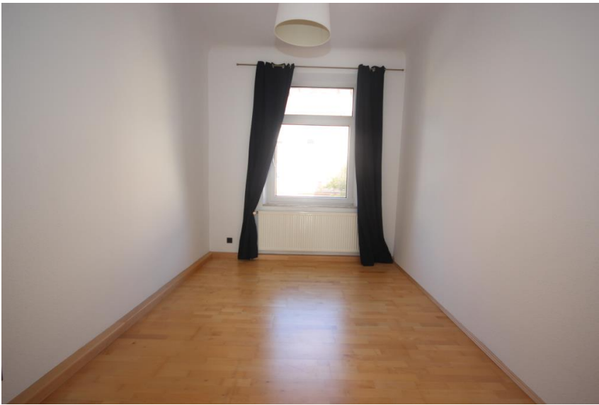
Perfekt für Homeoffice