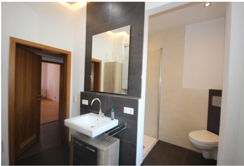
Wanne & Dusche