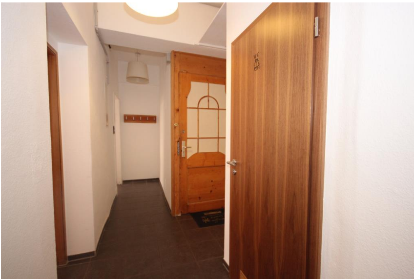
Flur & Garderobe