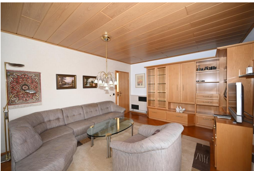
Wohnen mit Parkett