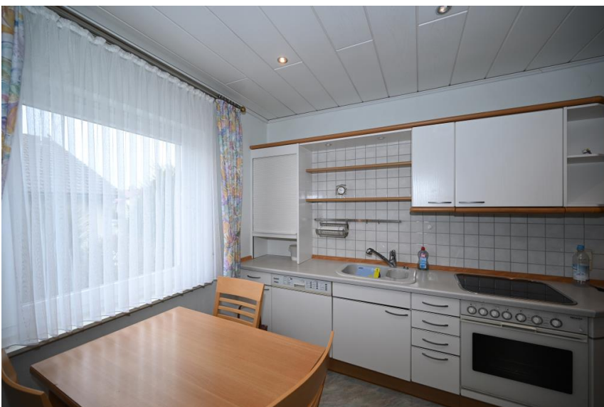
Auf Wunsch inklusive