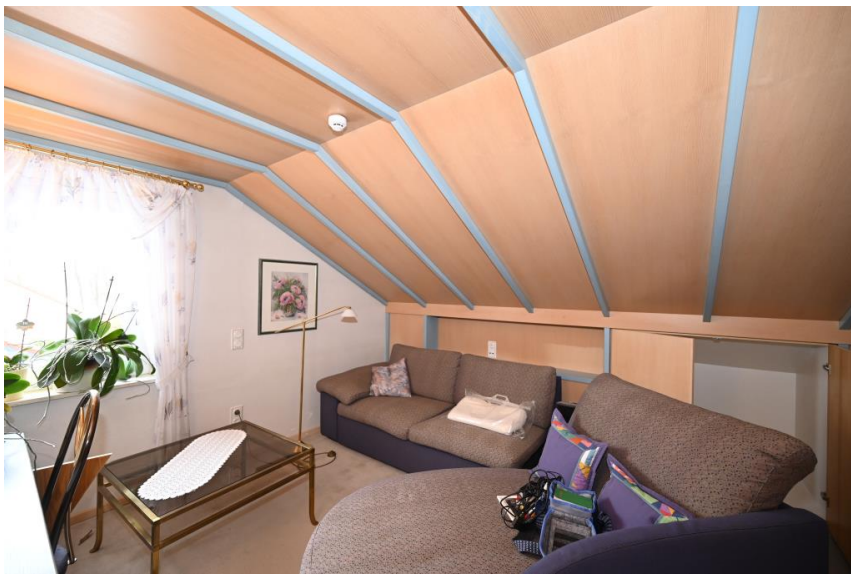
3x Schlafen unterm Dach