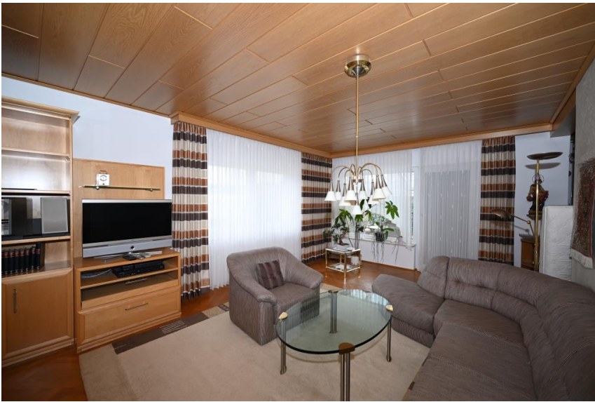
Fenster nach Süden & Osten