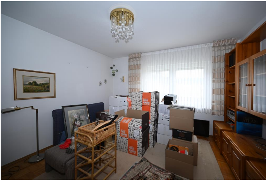
Elternschlafen im EG