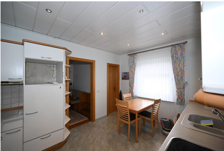
Wohnküche mit Speis