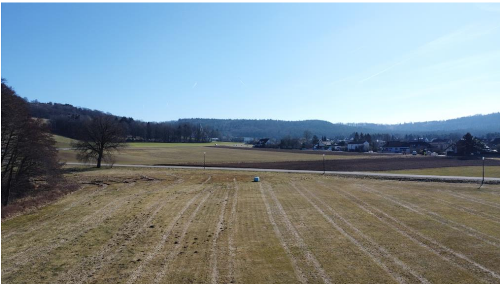
Felder & Wiesen

Wohnfläche: 117.0 m 2 Grundstücksfläche: 700.0 m 2