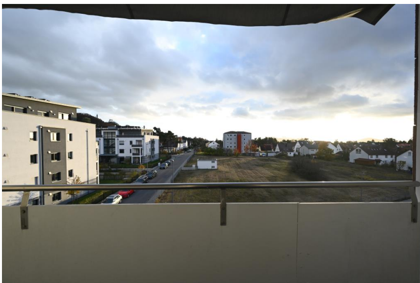
Ausblick vom Balkon