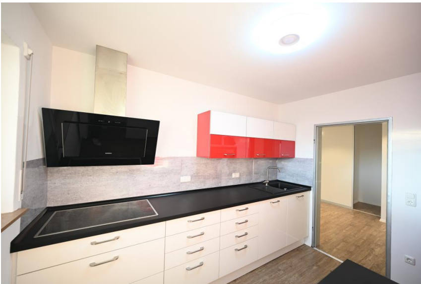
Modern & viel Platz