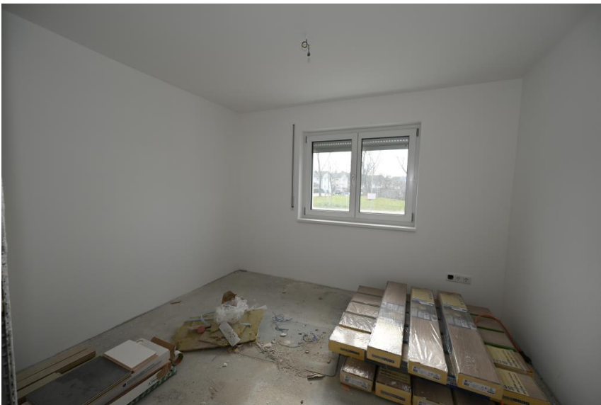
Ca. 10m 2 für Homeoffice