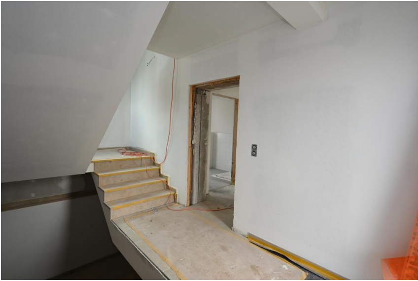
Wohnen im Zweifamilienhaus