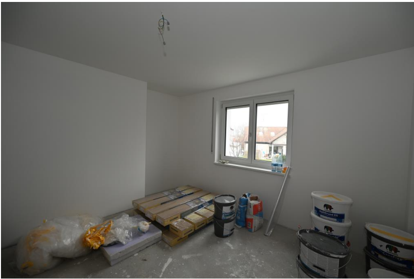
Schranknische im Eck