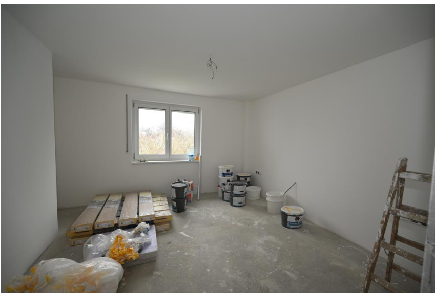
Schlafen abseits der Straße