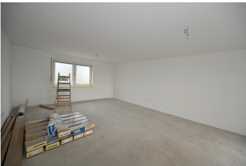
In perfekter Größe