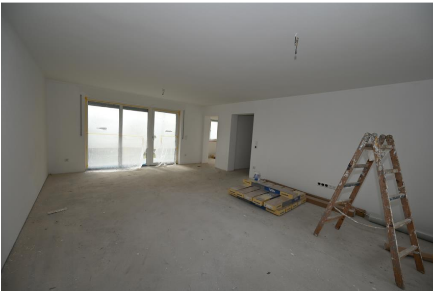
Highlight Wohnen & Essen