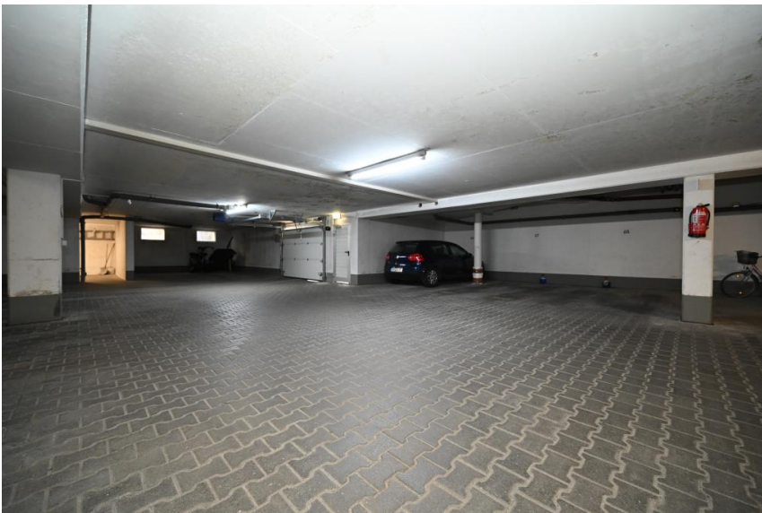
TG-Platz auf Wunsch