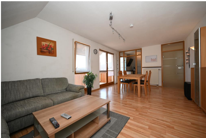
Offen & stilvoll gestaltet