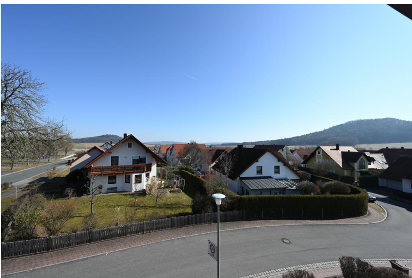
... mit Blick zum Mariahilfberg