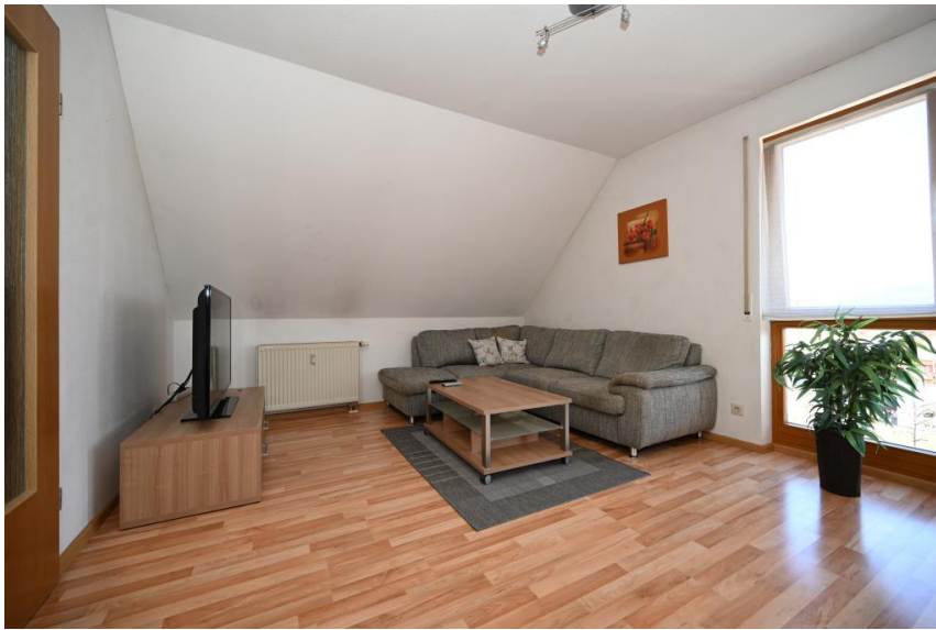
Wohnen in oberster Etage