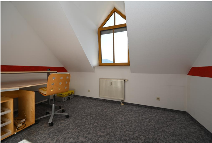
Kinderzimmer oder Büro