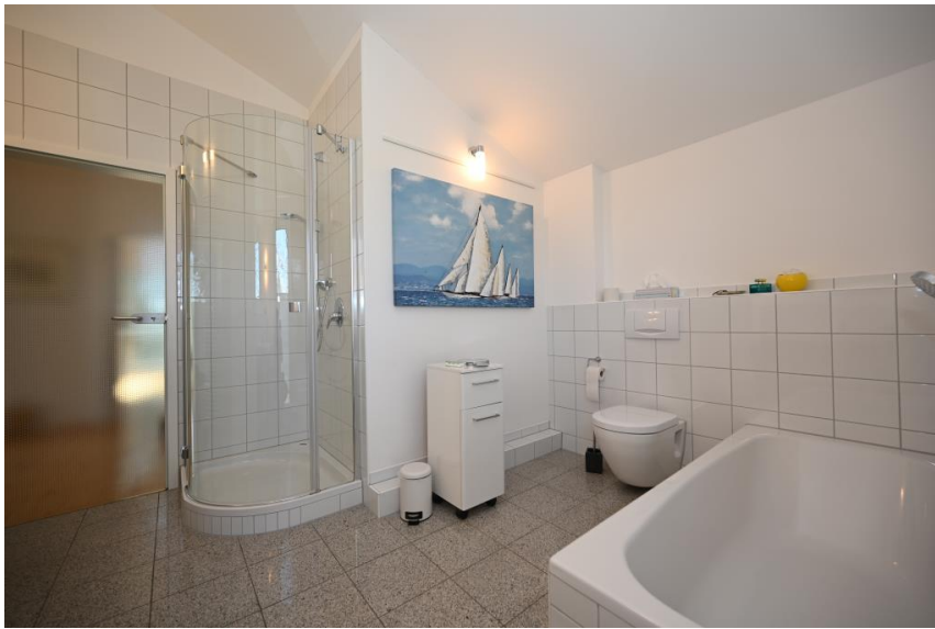
Das Badezimmer in Vollausstattung