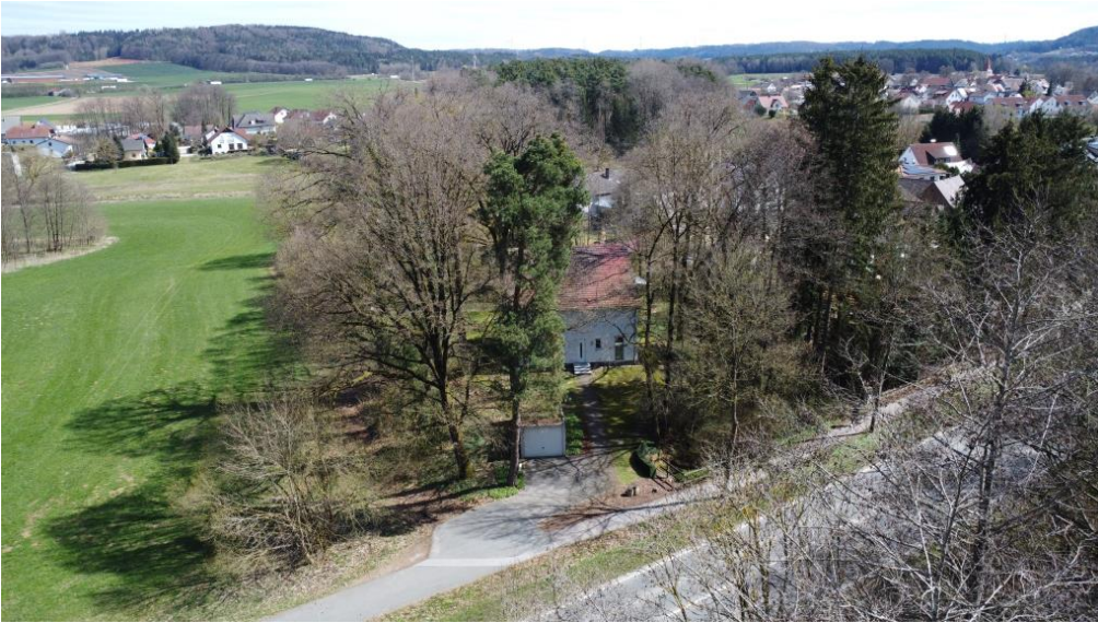
Hofeinfahrt mit Garage