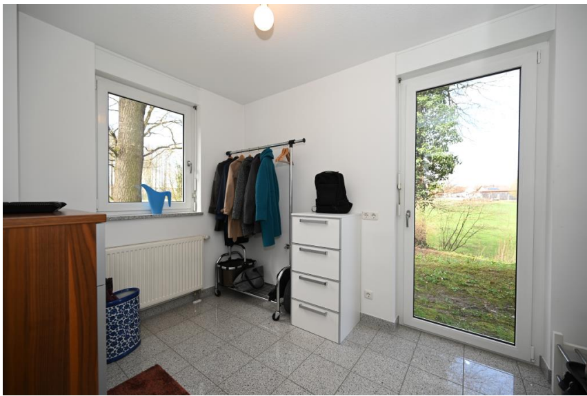
HWR oder Büro