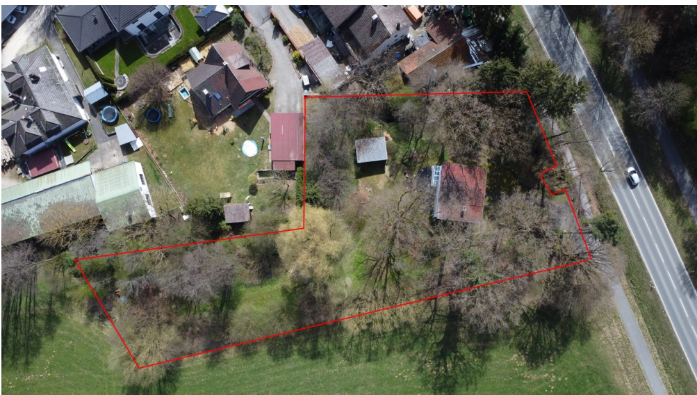
2.942 m 2 Natur pur