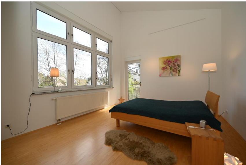
Das Schlafzimmer mit hohen Decken