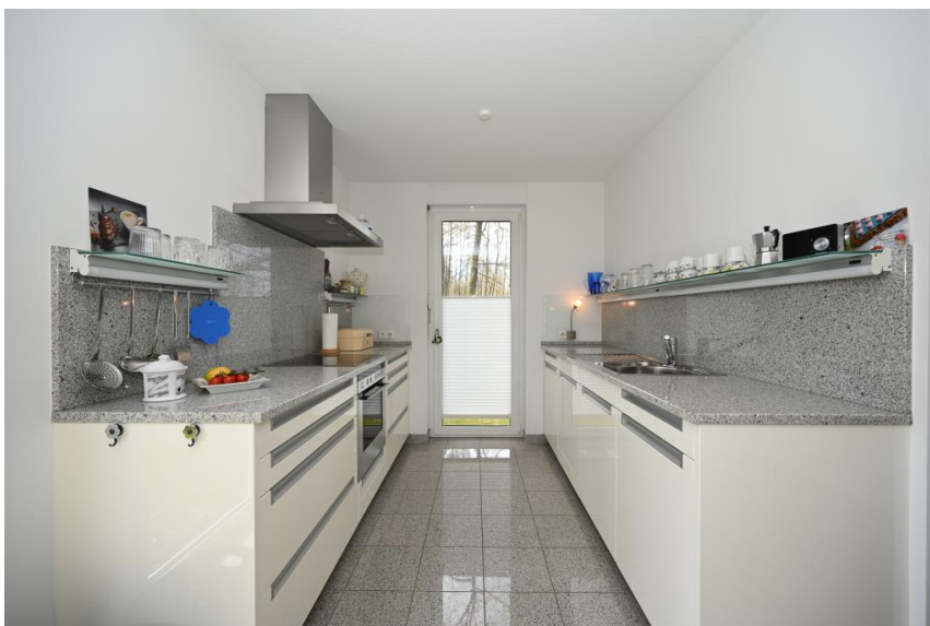
Wertige Einbauküche inklusive