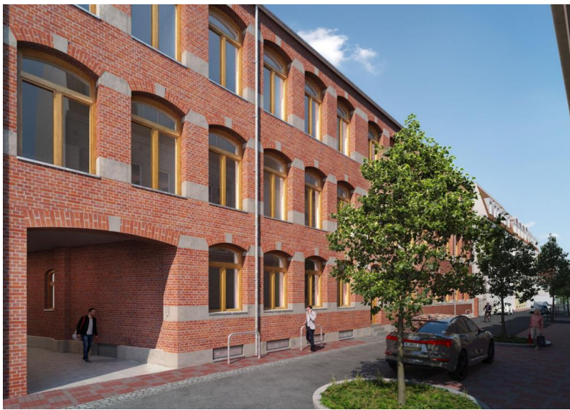
Nahe an der Altstadt