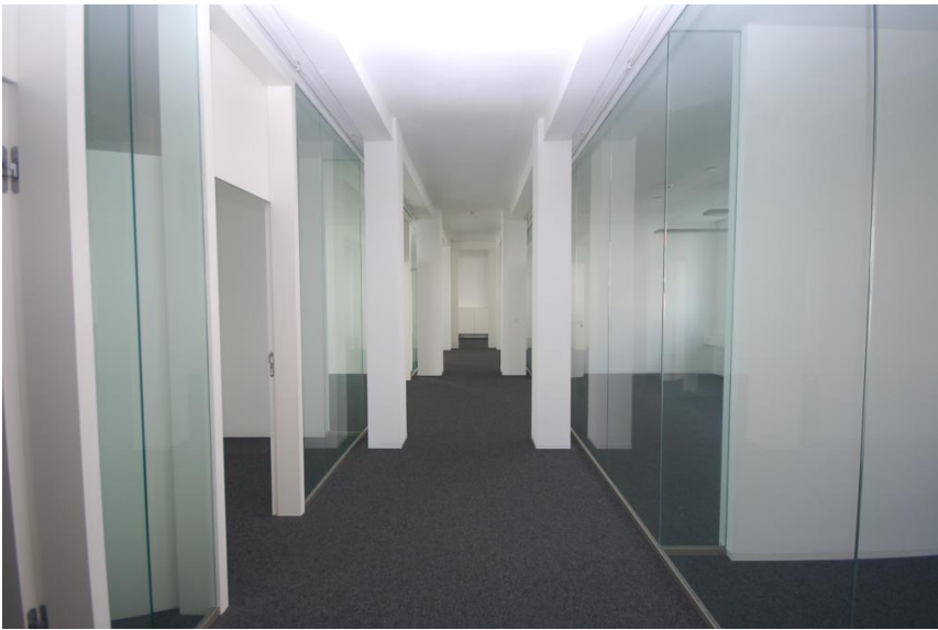
Viel Glas - viel Licht