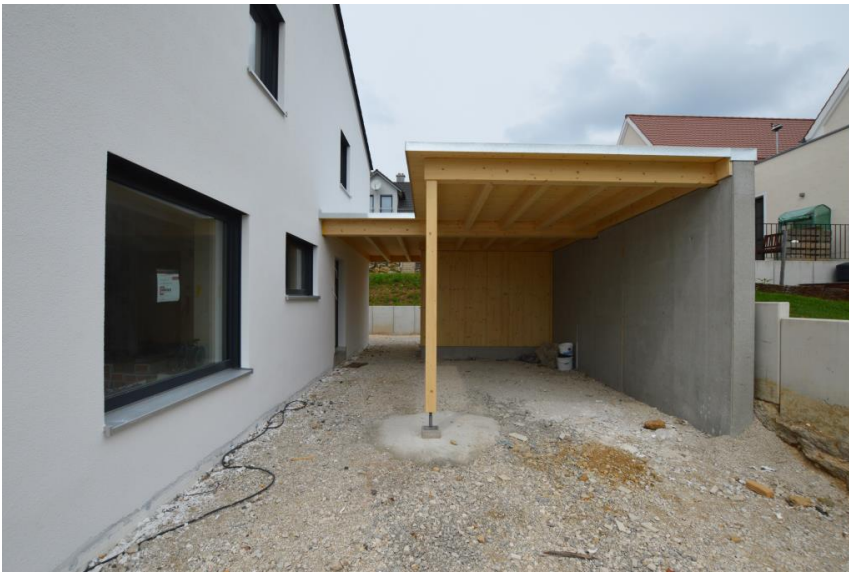
Carport und Geräteraum