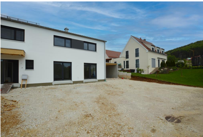
Süd-Terrasse und großer Garten

Wohnfläche: 160.0 m 2 Grundstücksfläche: 377.0 m 2