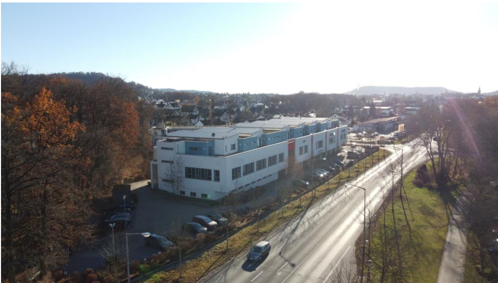
Bewährtes Wohn- und Geschäftshaus