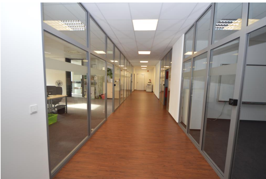
Modern und transparent