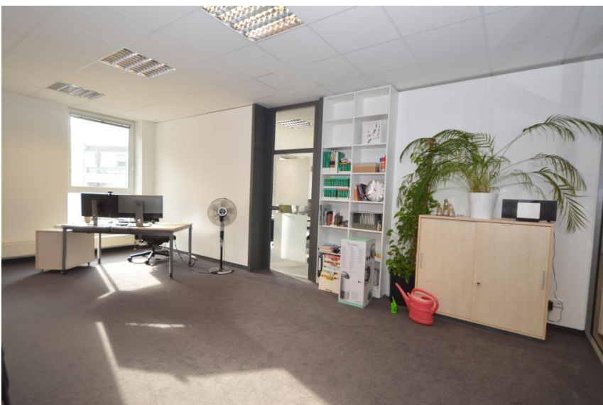
Teilweise miteinander verbunden