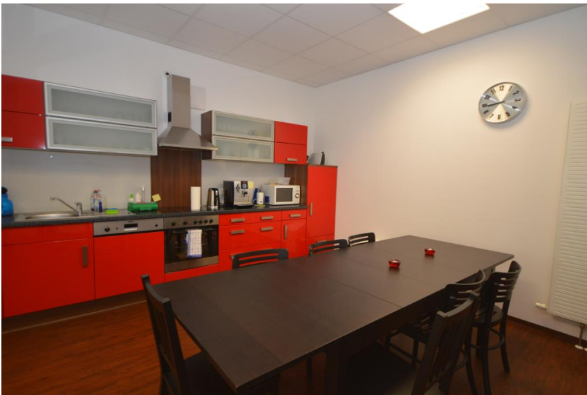
Eingerichtete Küche auf Wunsch