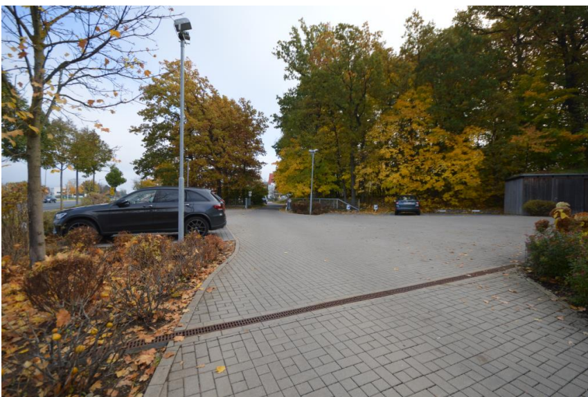
Viele Stellplätze auf Wunsch