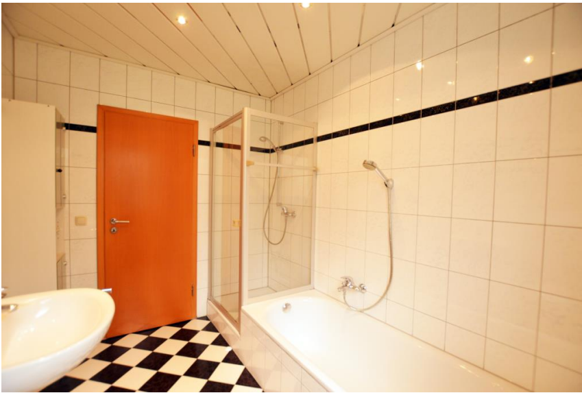
Wanne und Dusche