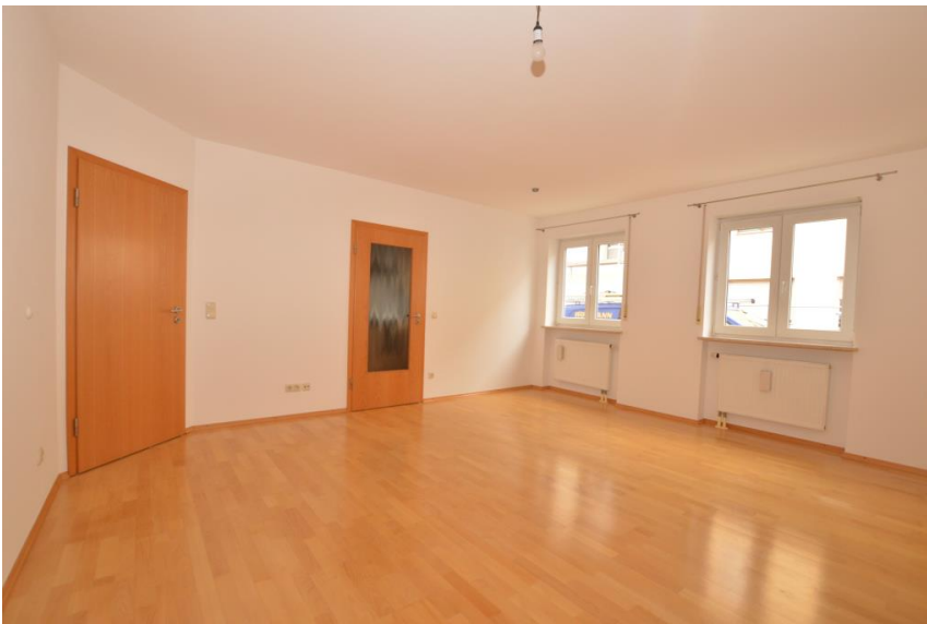
Wohnen & Essen