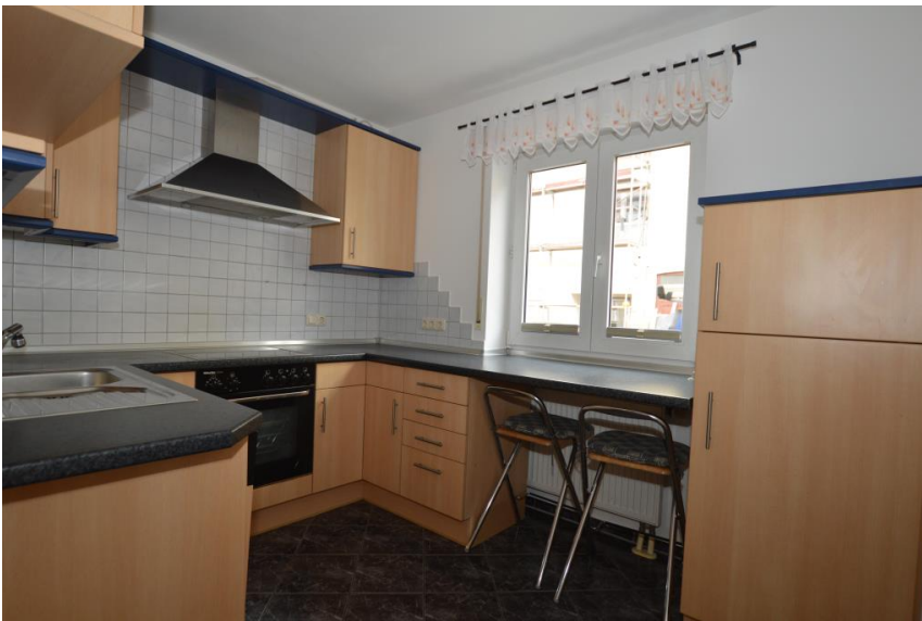
Küche mit Essplatz