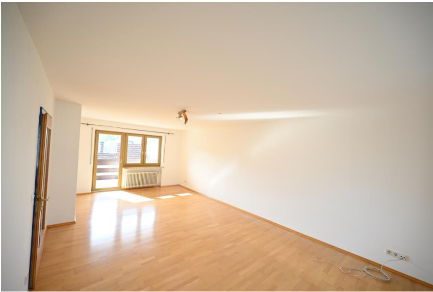
Großer & heller Wohn-/Essbereich