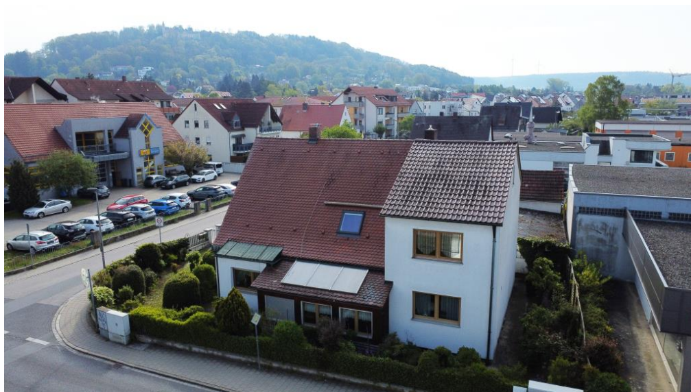
Natur und Innenstadtnah