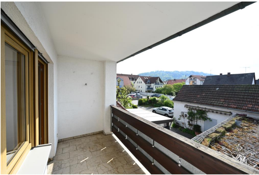
Geschützte Loggia mit viel Platz