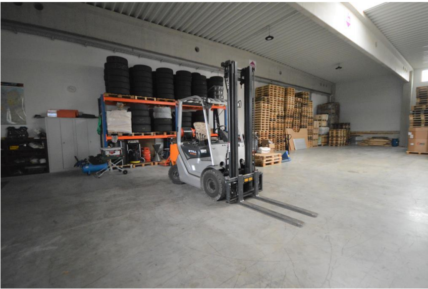
Staplermitbenutzung a. Wunsch