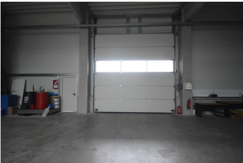
Sektionaltor - elektrisch