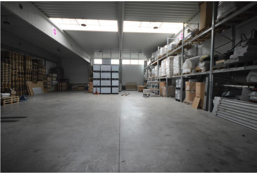
Stützenfrei und isoliert