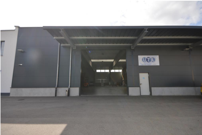
Geschützt mit Vordach

Gesamtfläche: 142.0 m 2 Nutzfläche: 142.0 m 2 Lagerfläche: 120.0 m 2