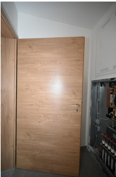
Sehr gute Ausstattung