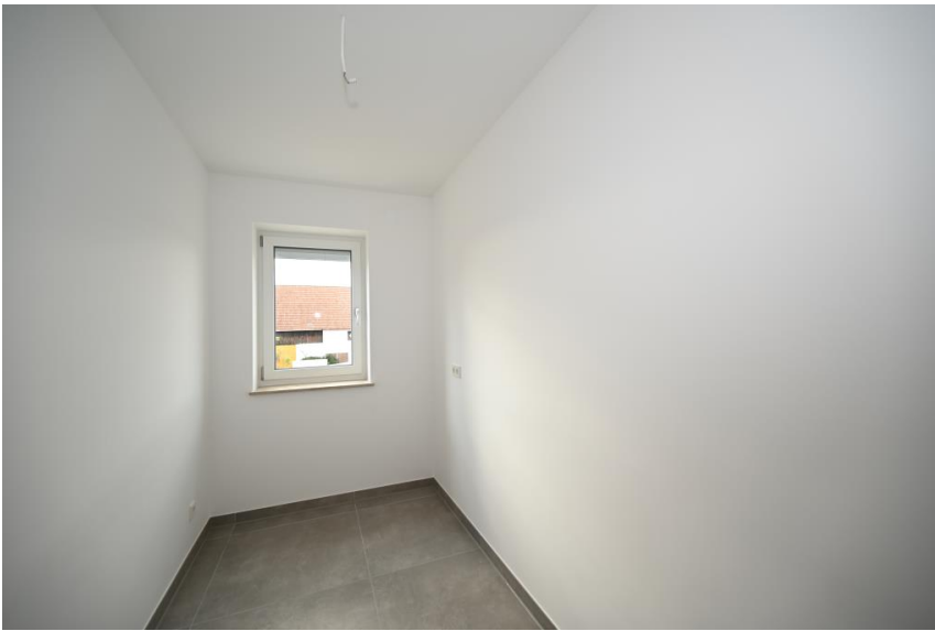
Abstellraum in der Wohnung