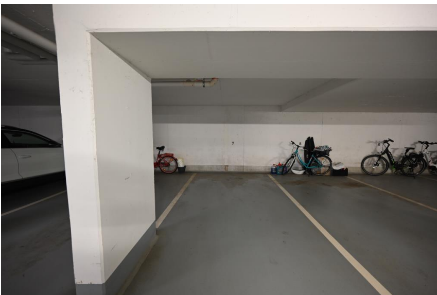
TG-Stellplatz auf Wunsch