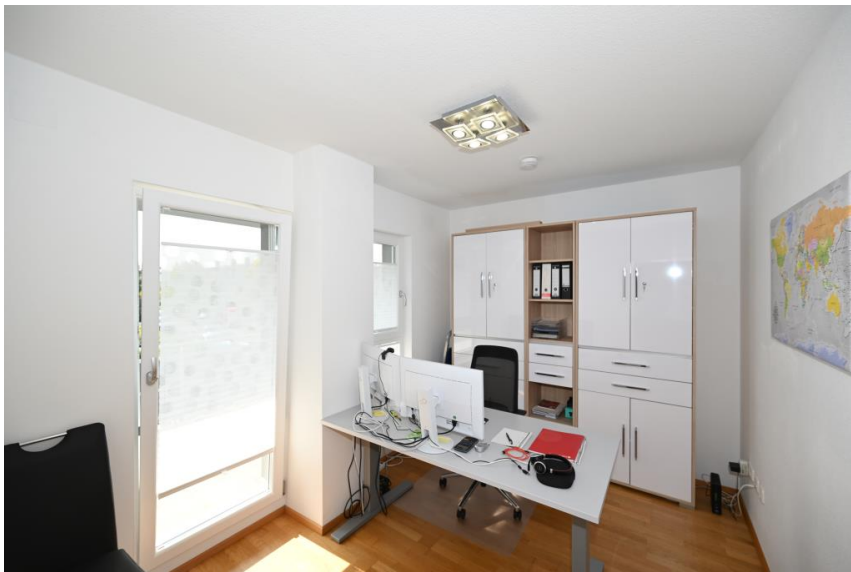
Drittes Zimmer mit Zugang zum Balkon