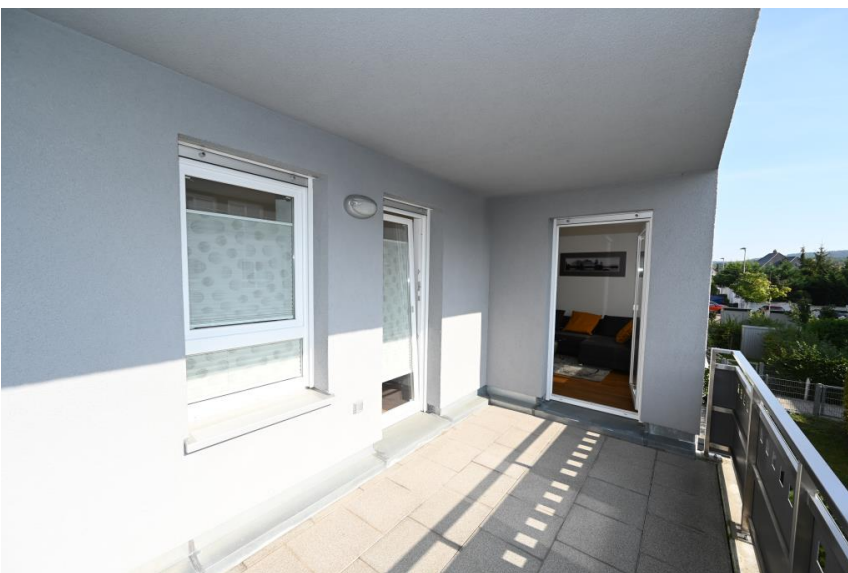
Geschützt & gut ausgerichtet