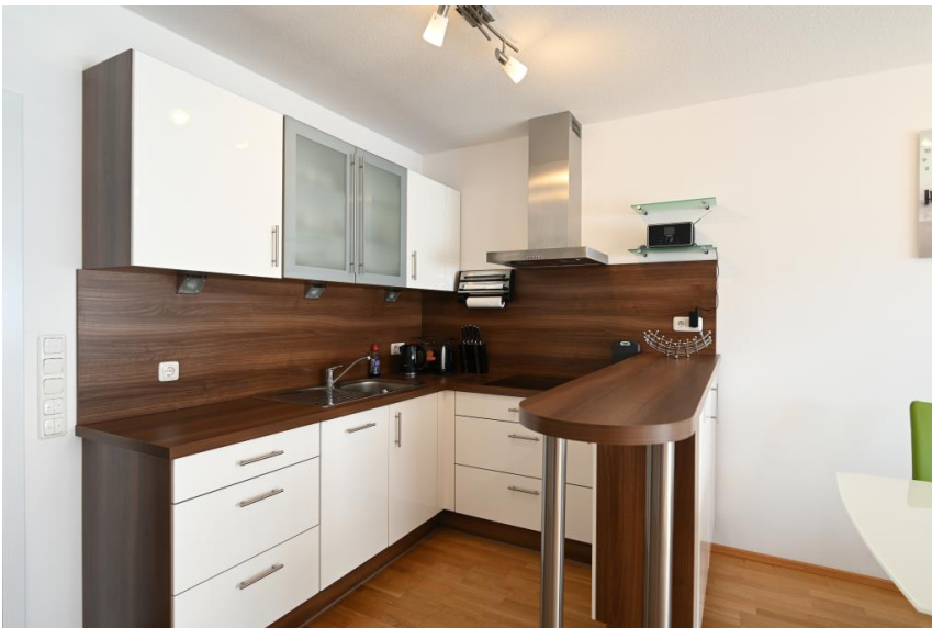
Küche mit Theke für gesellige Runden