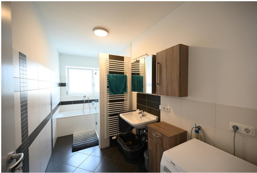
Großes und modernes Badezimmer