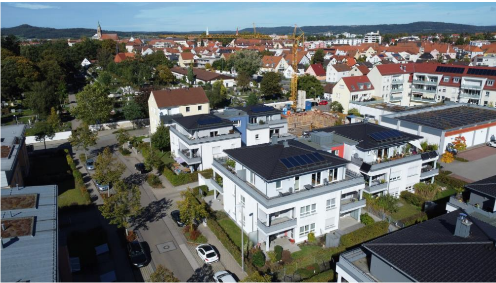
Zentrale & ruhige Lage