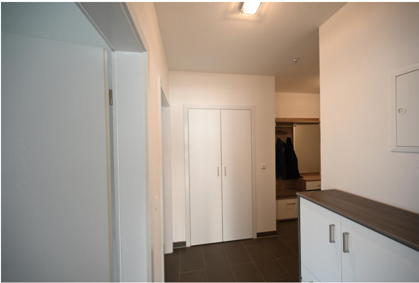
Diele mit Abstellkammer