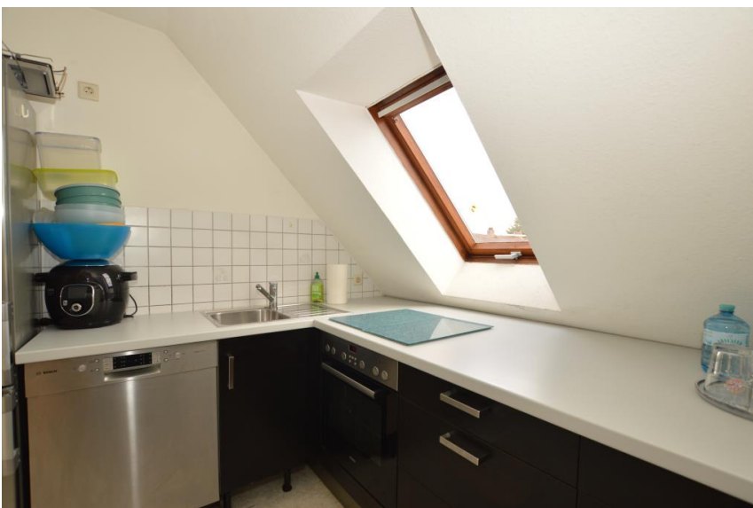
Küche auf Wunsch