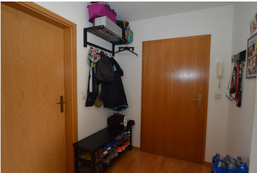
Eingang mit Garderobe