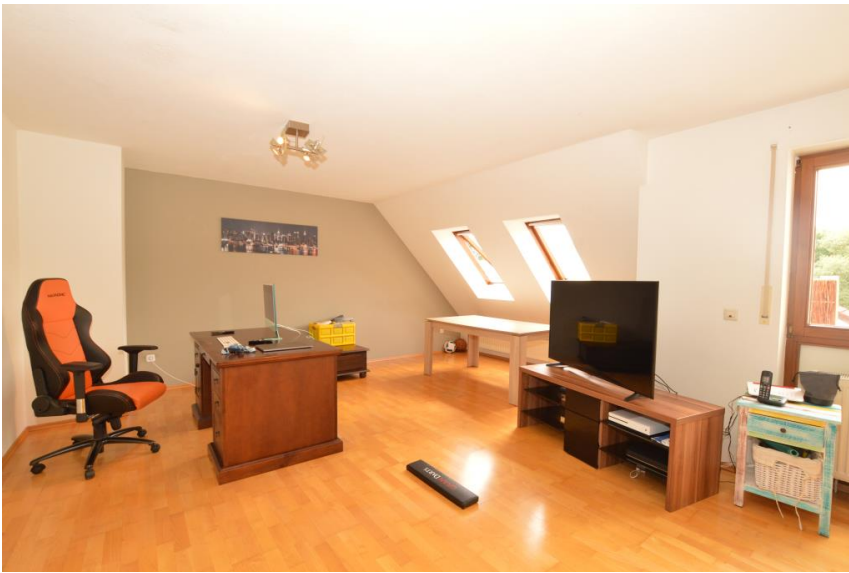
Wohnen mit Parkett