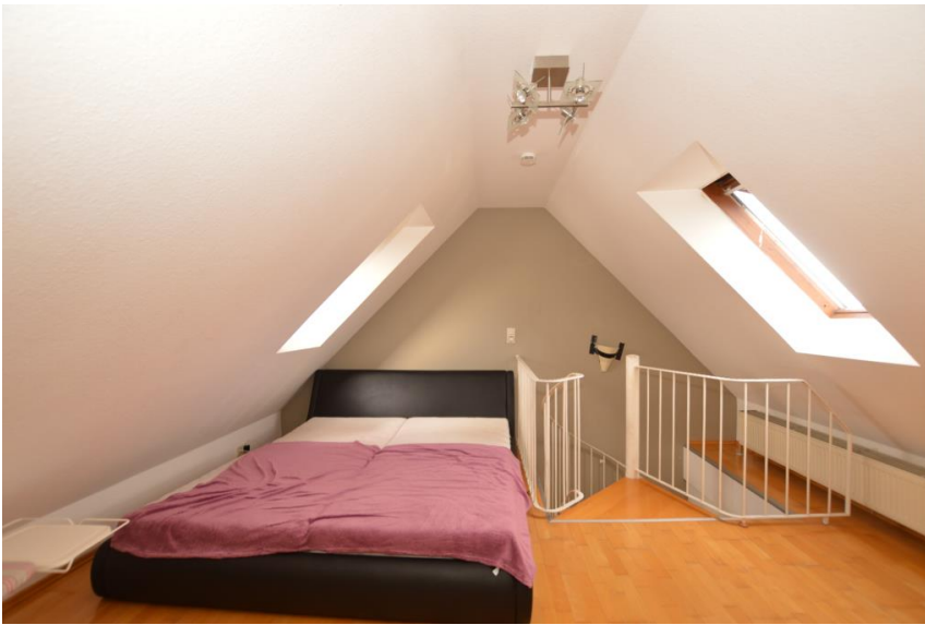
Schlafen unterm Dach