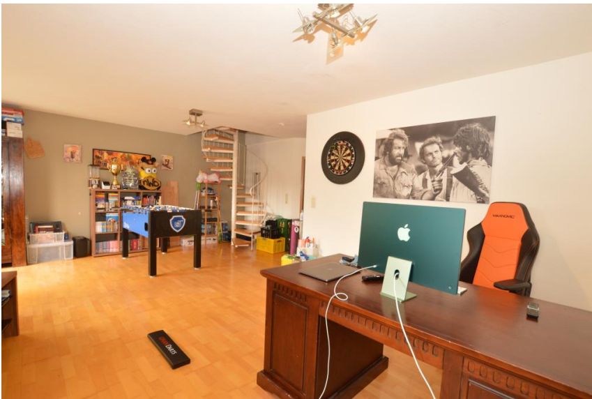
Wendeltreppe ins Studio