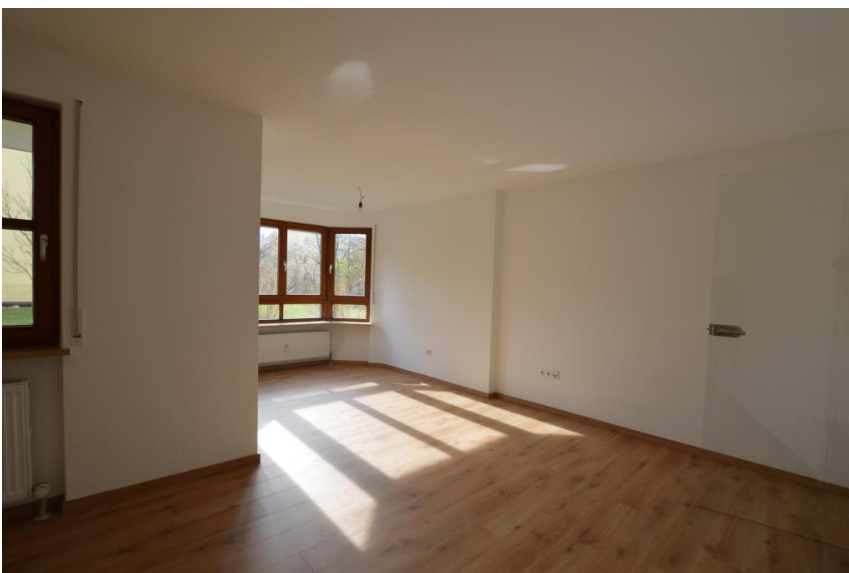
Kombiniert Wohnen & Essen