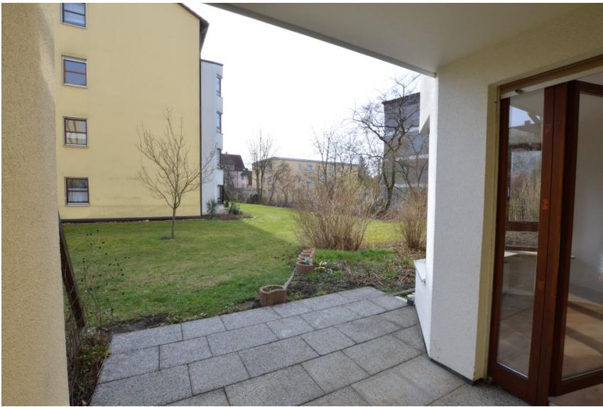
Abstand zu Nachbarn