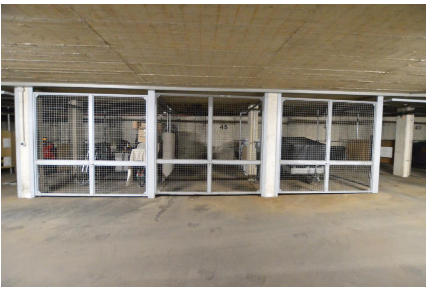
TG-Box auf Wunsch