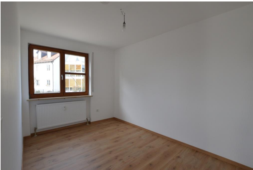
Büro oder Kind