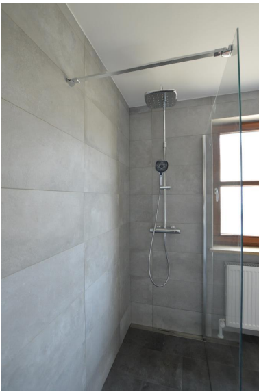
Galskabine mit Regenbrause