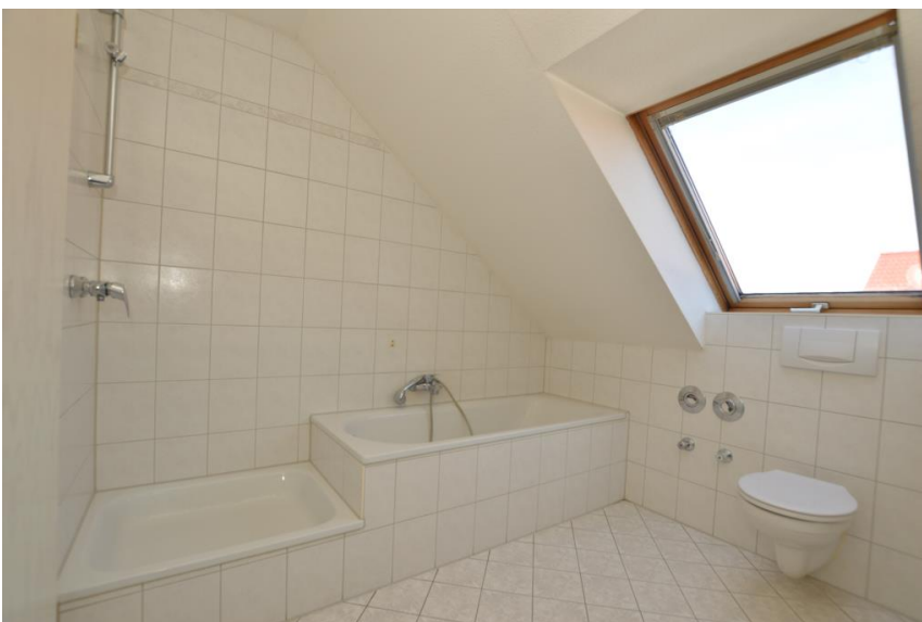
Bad in Komplettausstattung