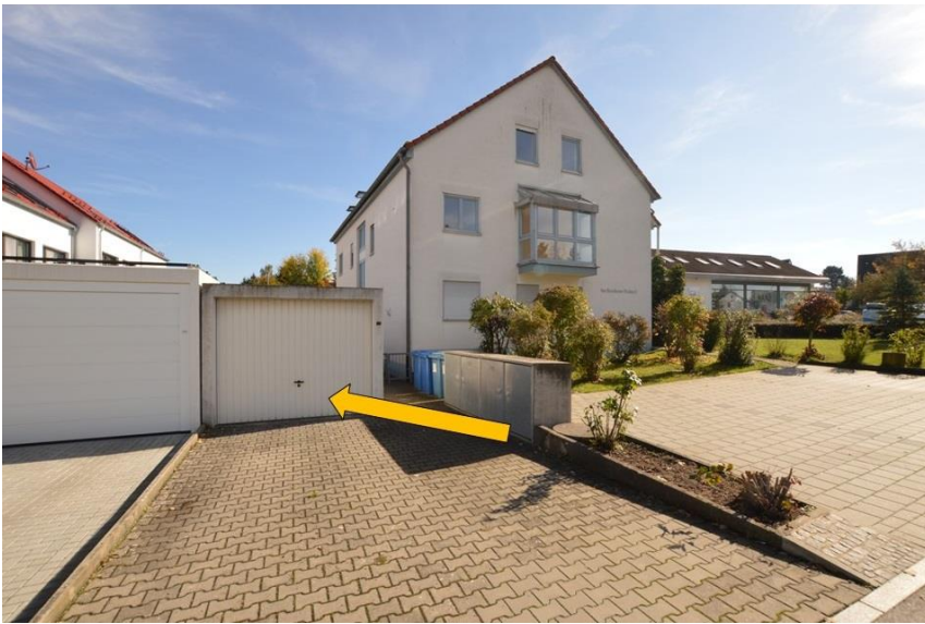
Garage direkt am Eingang