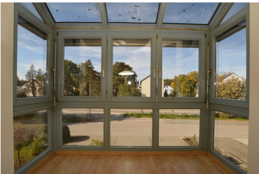
Highlight - der Wintergarten