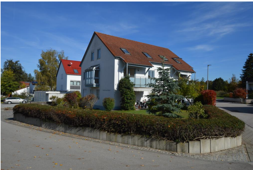
Nahe am Zentrum