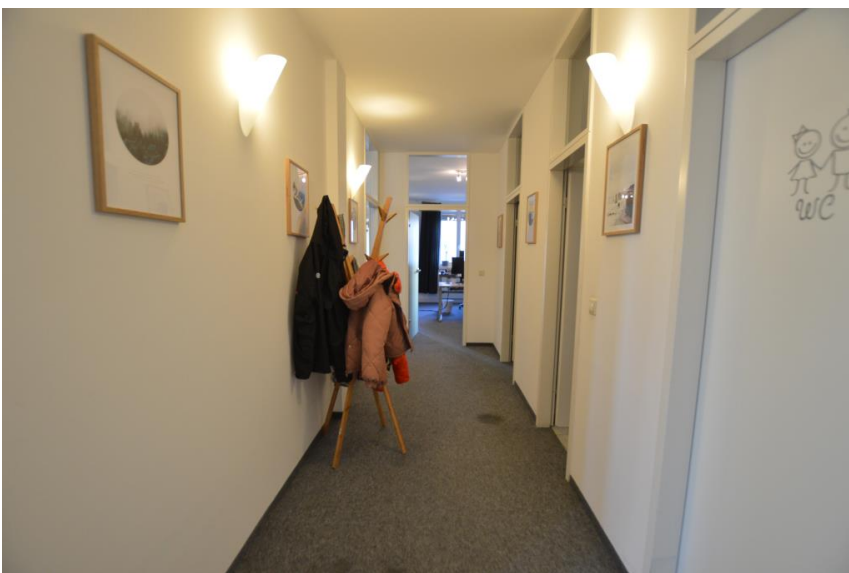
Neue Böden auf Wunsch