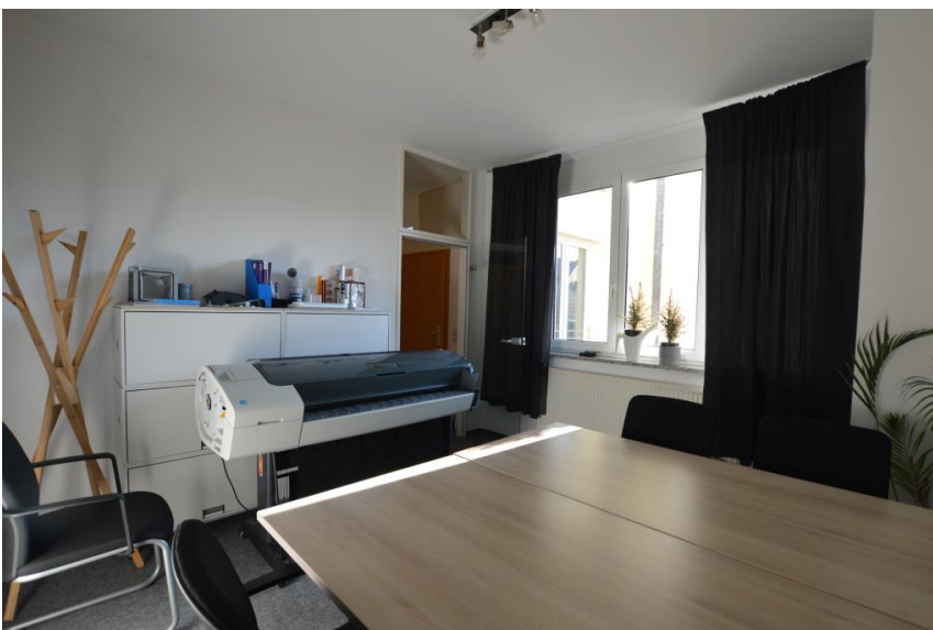
3 Einzelbüros möglich