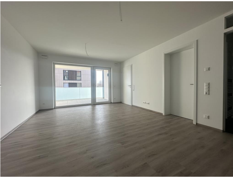
Helles, offenes Wohnen