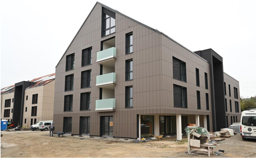
Am Bräuhaus - Haus B2