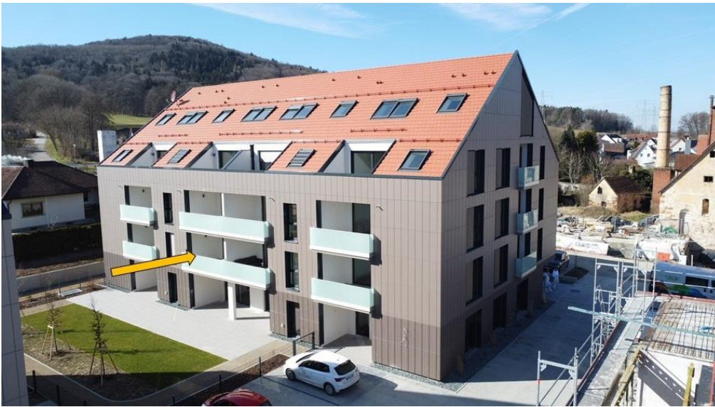
Wohnen im 1. OG