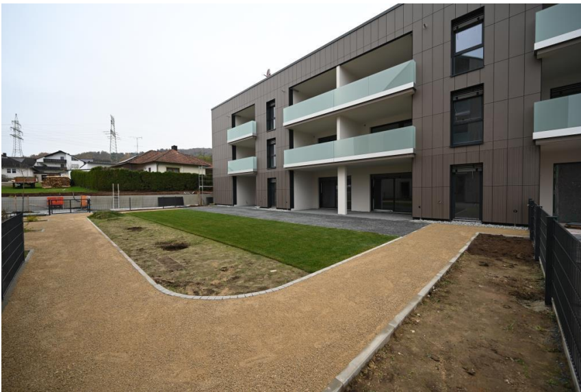
Tagespflege bei Bedarf