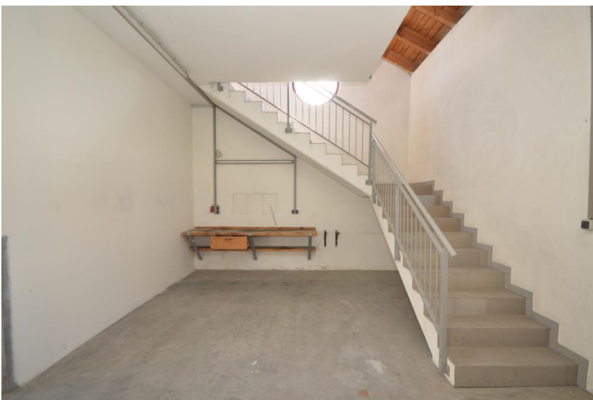
Aufgang zum OG