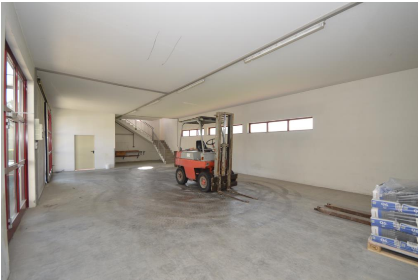
Große, flexible Teilfläche