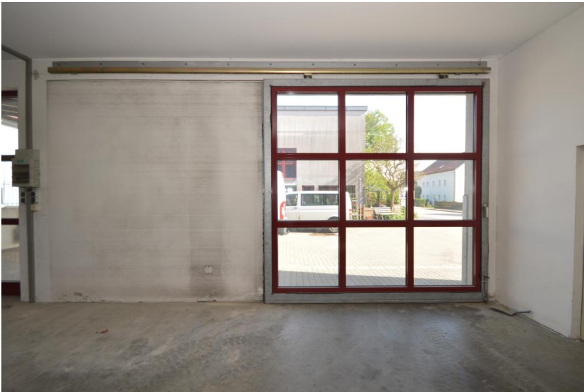
Großes Schiebeelement ...