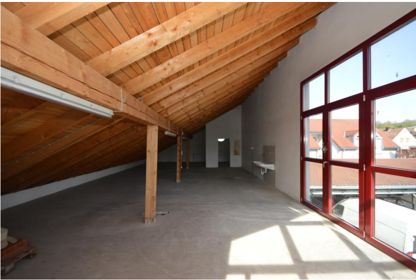
Zusätzliche Lagerfläche ...