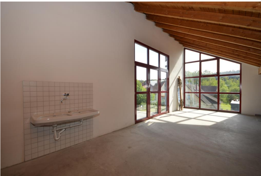
... bzw. Ausstellungsfläche