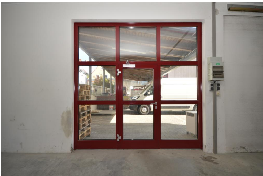
... sowie Eingangstür