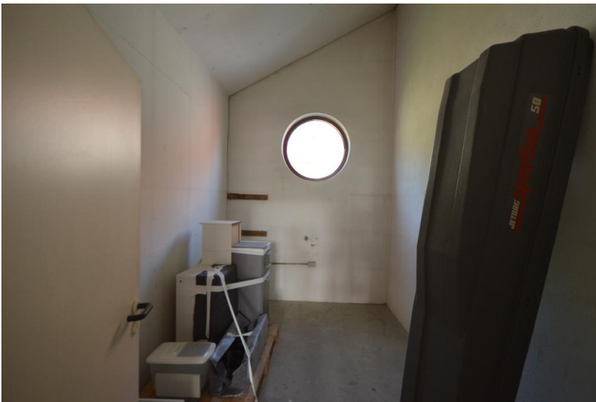
Lagerraum im EG