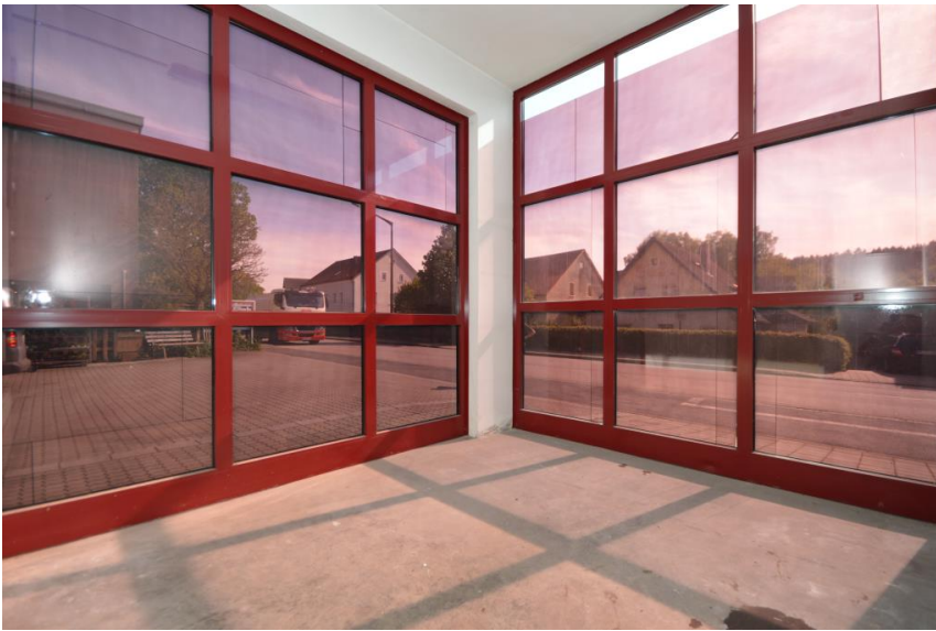
Blickfang von der Straße