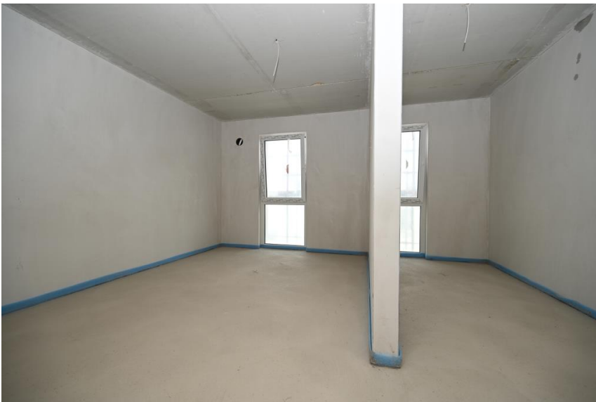
Eltern-Schlafen mit Ankleide