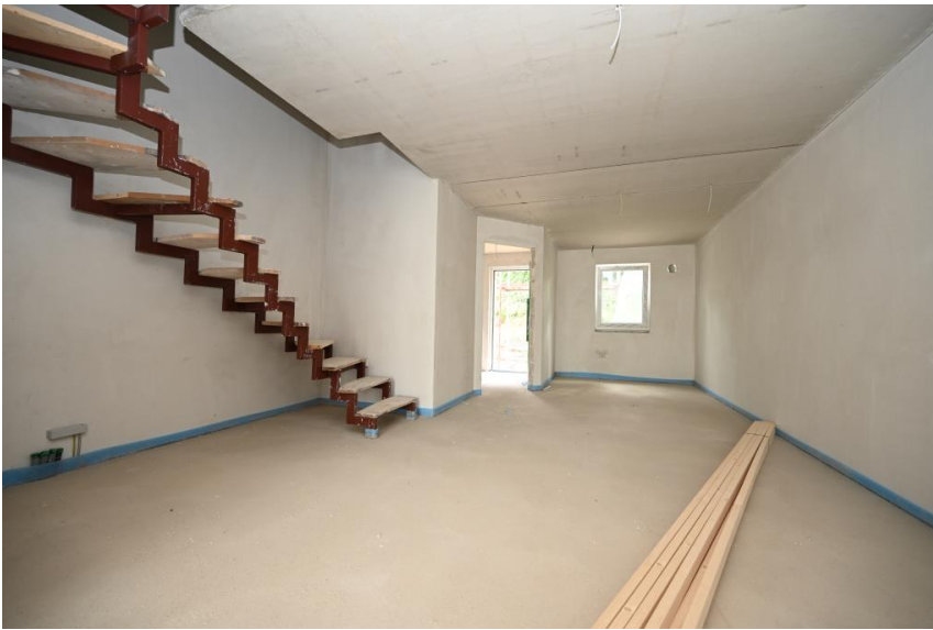
Geräumiges Essen u. Kochen