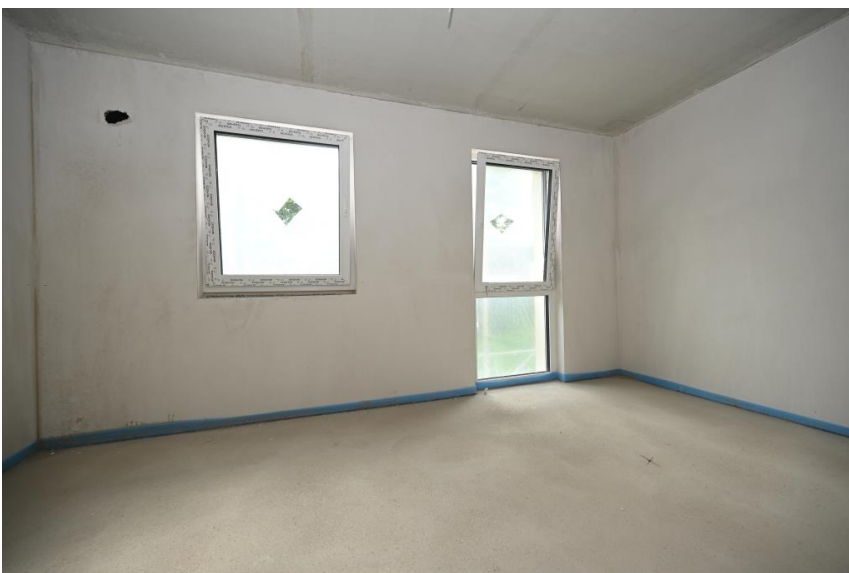
3 Kinderzimmer bzw. Büros