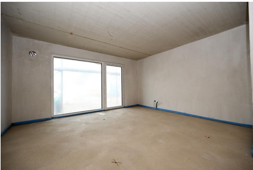
Großes, helles Wohnen