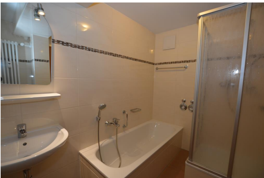
Renoviertes Bad ...