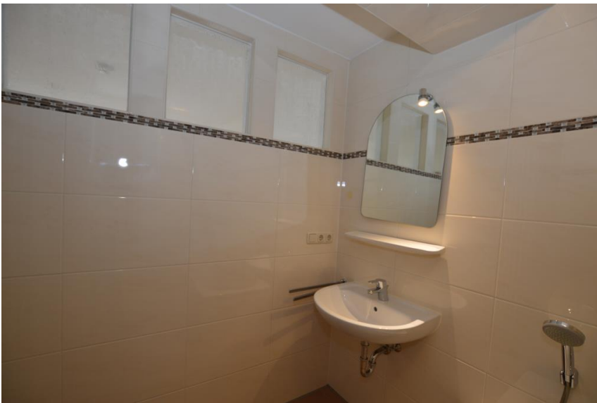
... sowie Lichtband