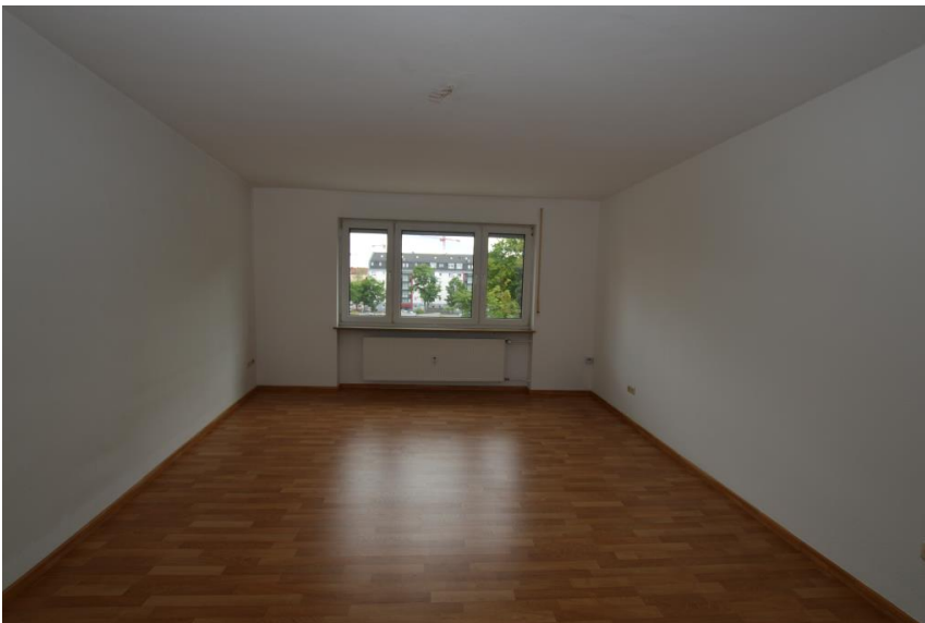
Großzügiges Wohnen ...