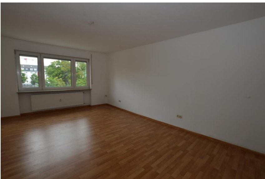
... mit vielen Stellmöglichkeiten