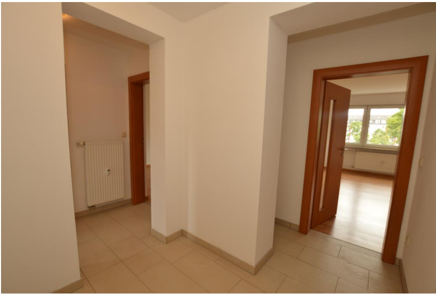
Platz für die Garderobe