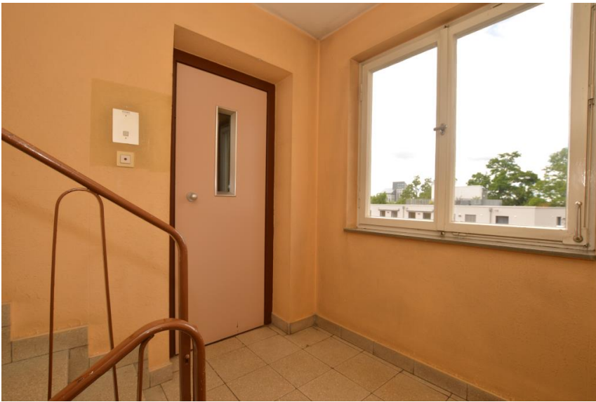
Aufzug im Haus