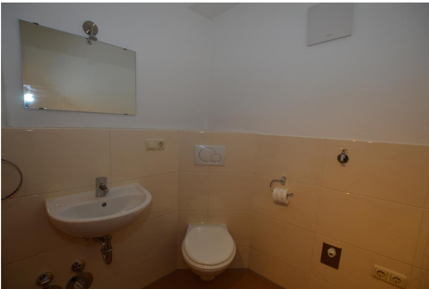
Toilette mit WM-Anschluss