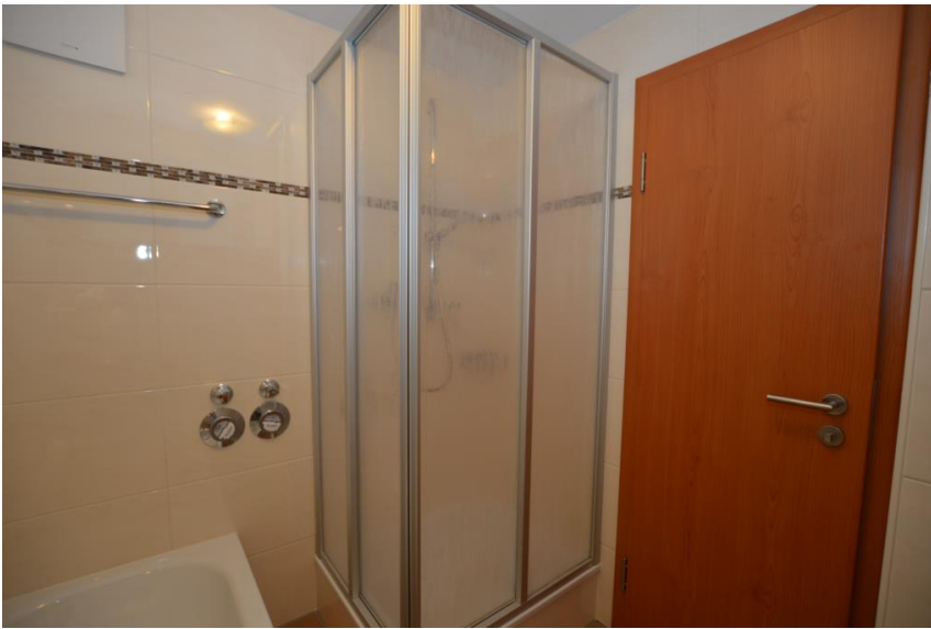
... mit Wanne & Dusche ...