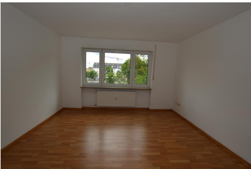
Helle, lichtdurchflutete Räume