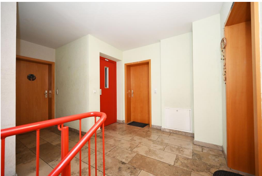
Aufzug im Haus