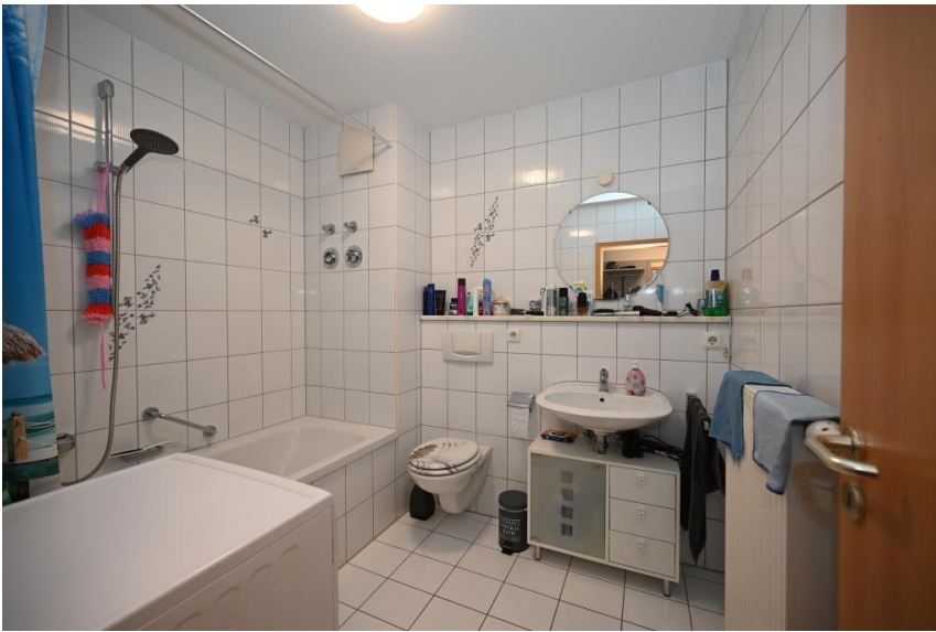
Zeitlos gestaltetes Bad