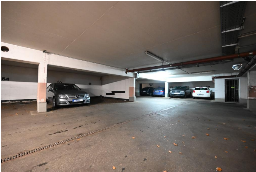
TG-Stellplatz auf Wunsch