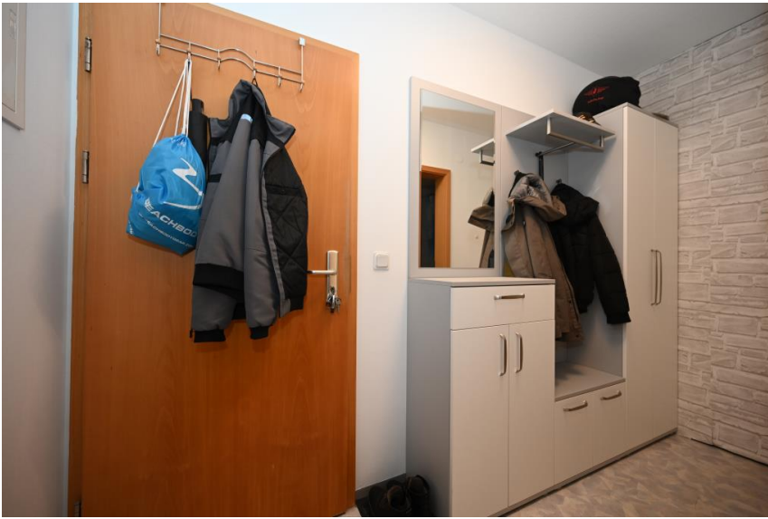
Garderobe + Abstellraum