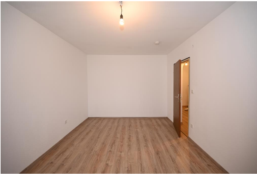
Platz für Schrank