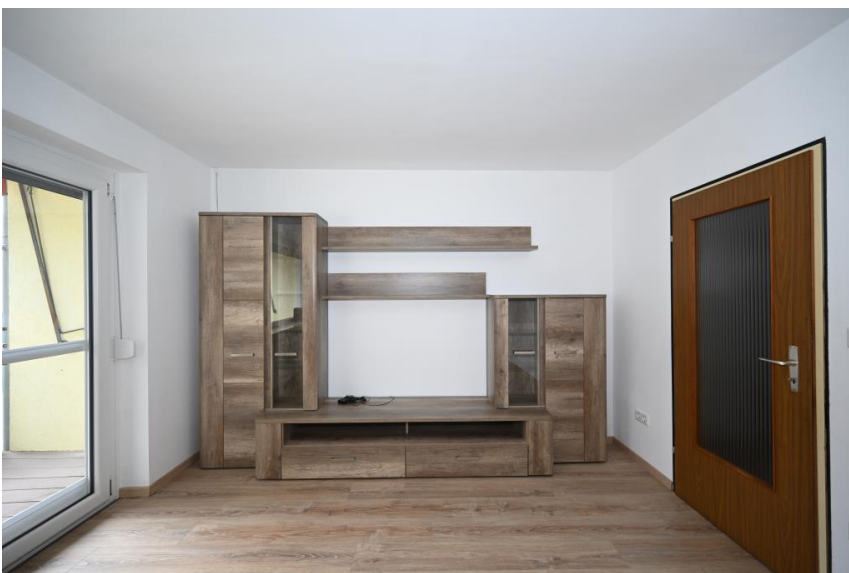
Gut zu möblieren