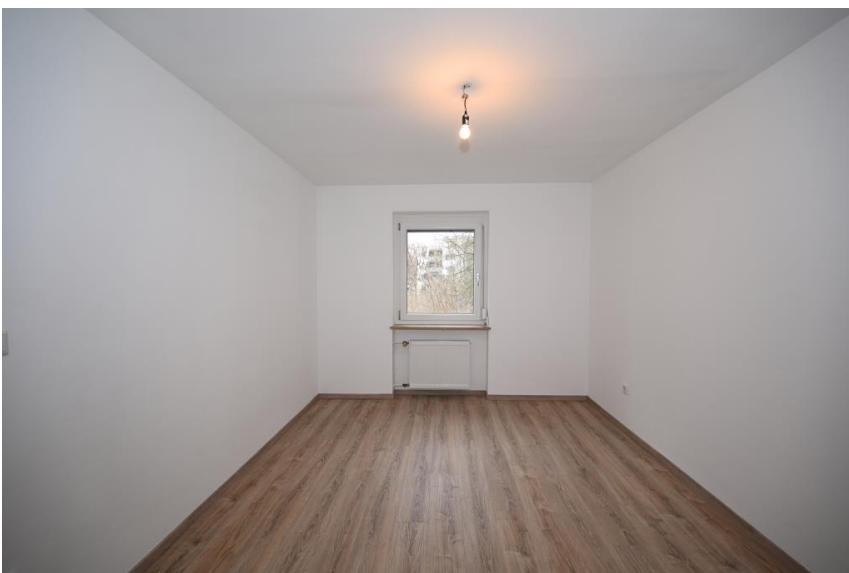
Zum Innenhof hin