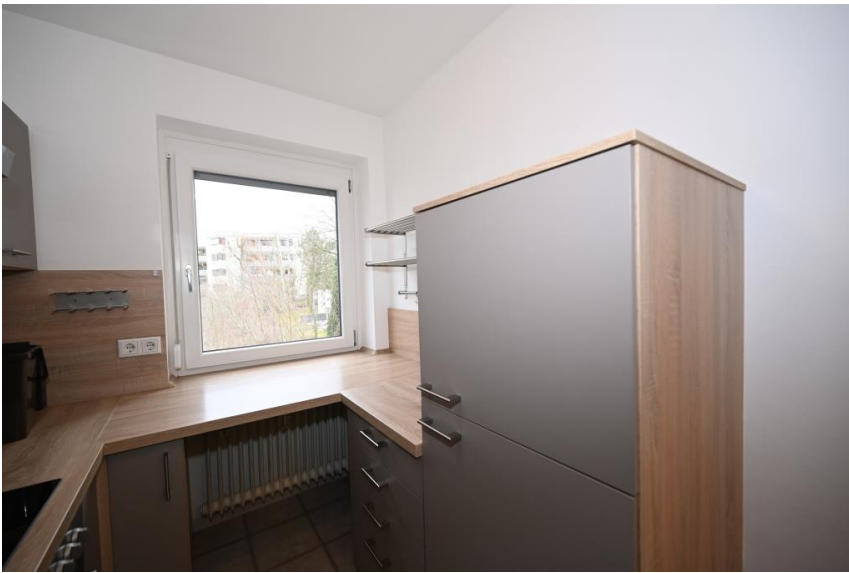
Komplett mit Kunststofffenster