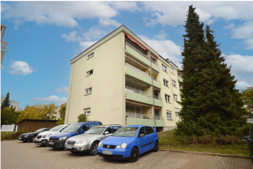
Parken für Anwohner