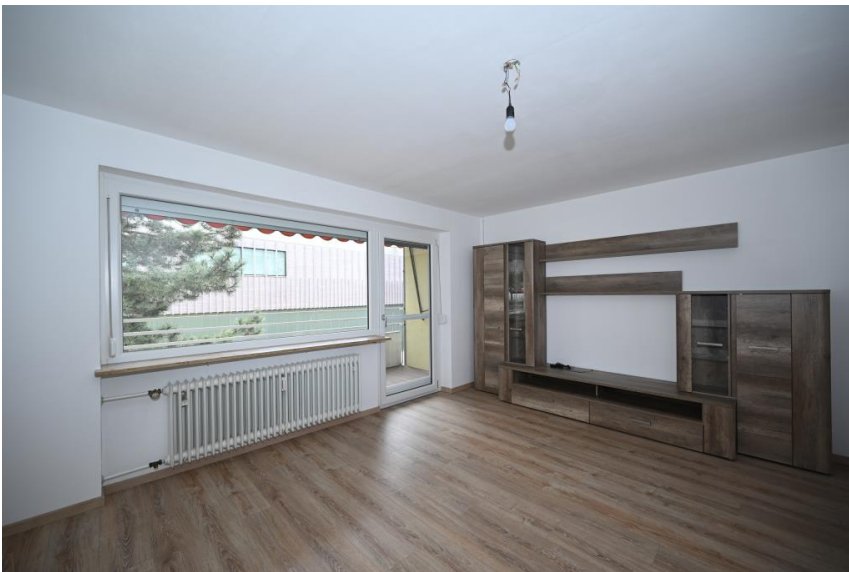
Schrankwand auf Wunsch