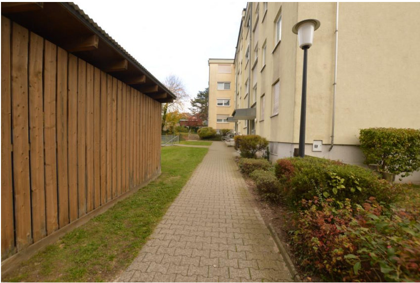
Zugang zum Haus