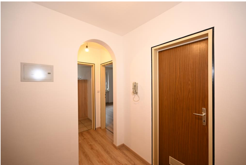
Windfang mit Garderobe