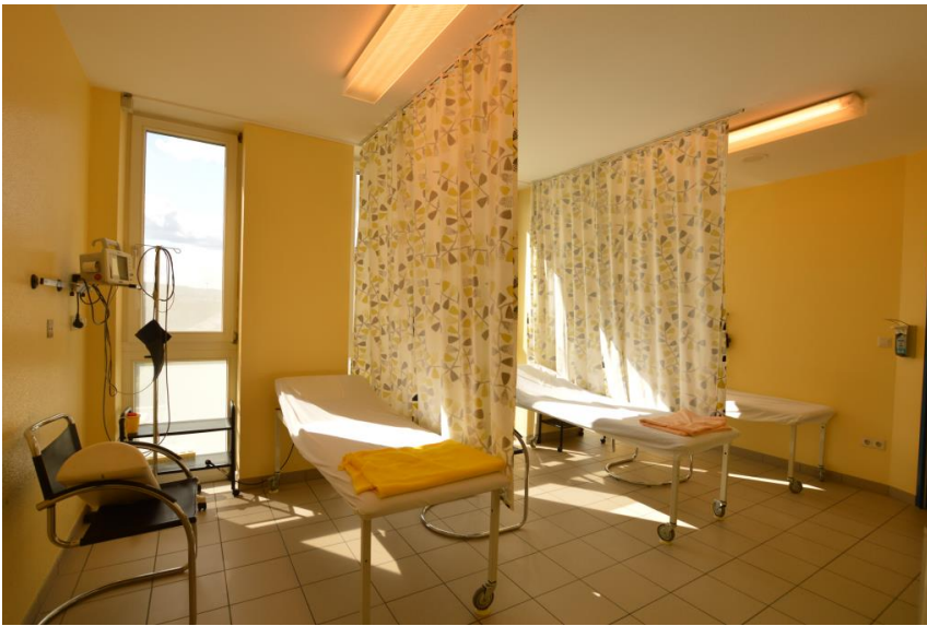
2 x Aufwachraum