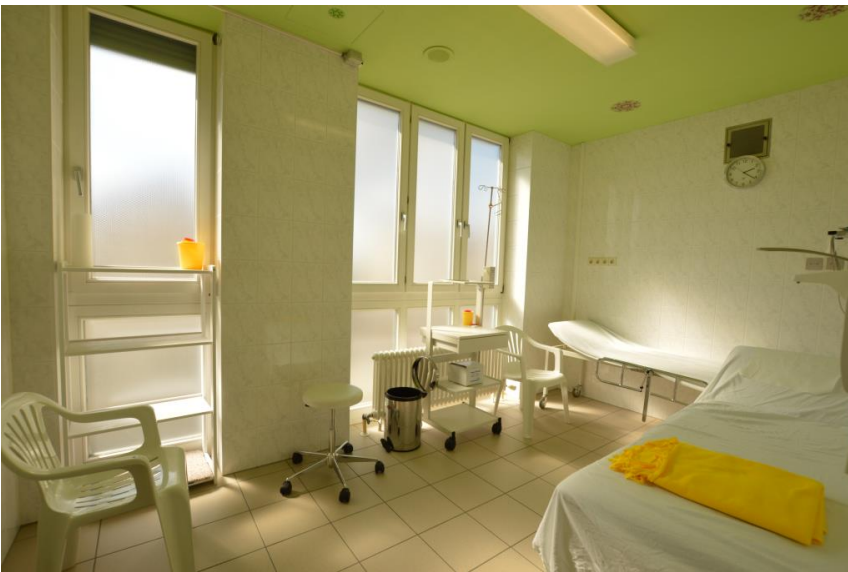
Geeignet für Arzt + Büro