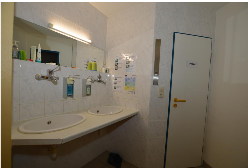
4 x Sanitär