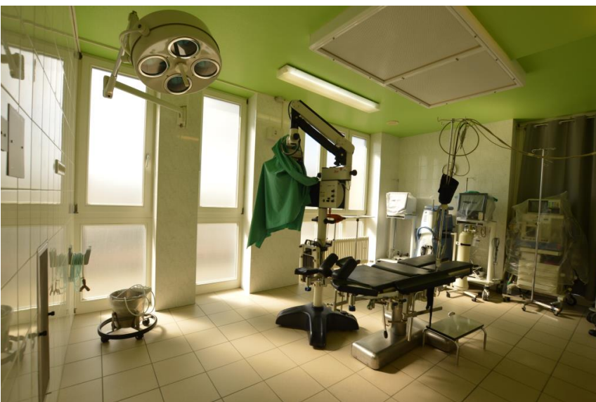
2 x OP Raum