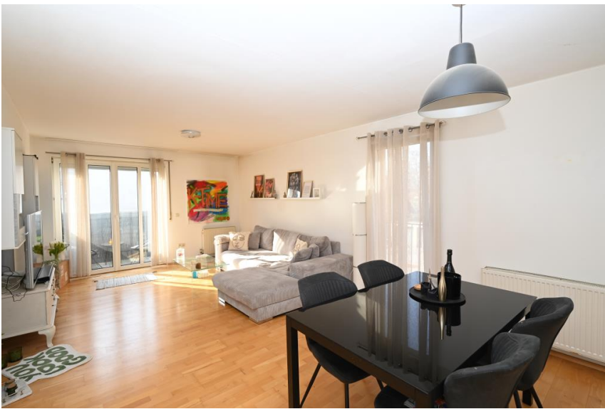
Wohnen mit Essplatz