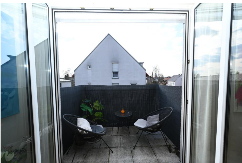
Balkon nach Westen