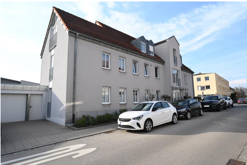
Wohn- und Geschäftshaus