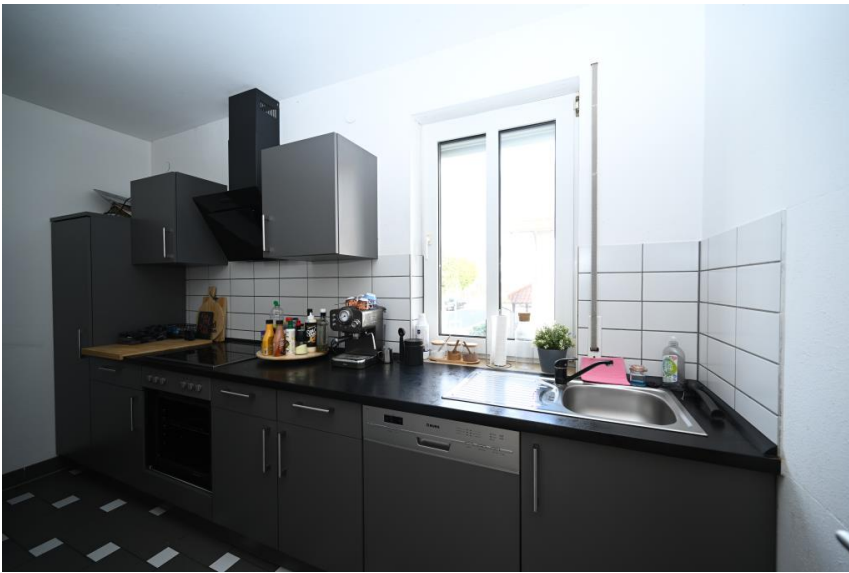
Einbauküche auf Wunsch