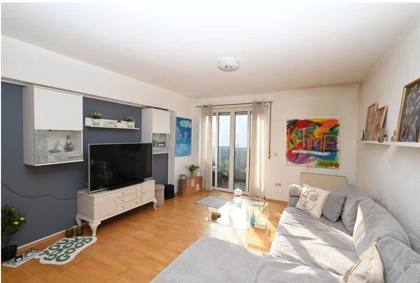
Platz für große Möbel