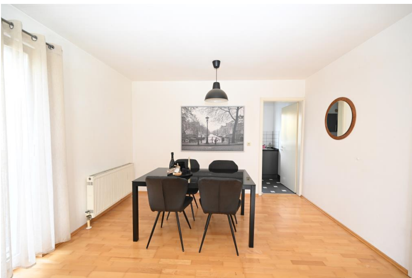
Essplatz nah an der Küche