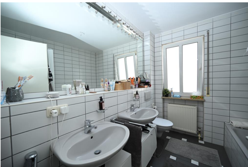
Tageslichtbad für Zwei