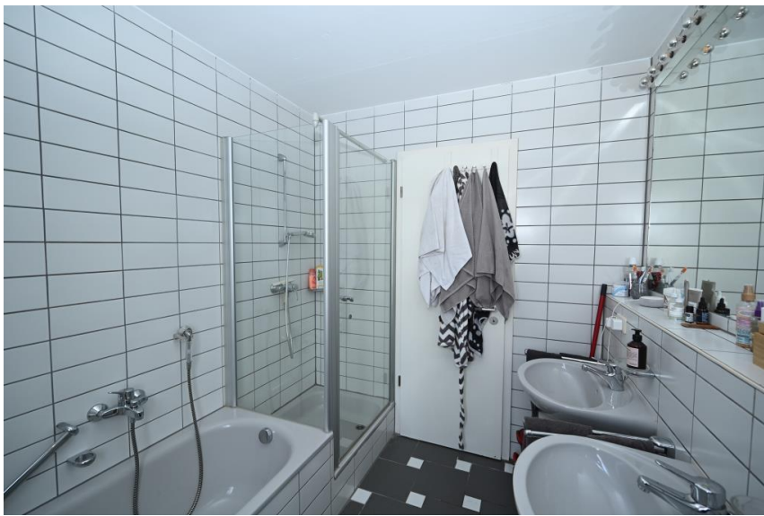
Hell & Zeitgemäß