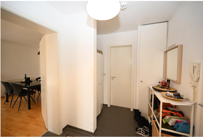
Flur mit Garderobe