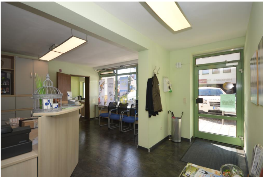
Hell durch große Fenster