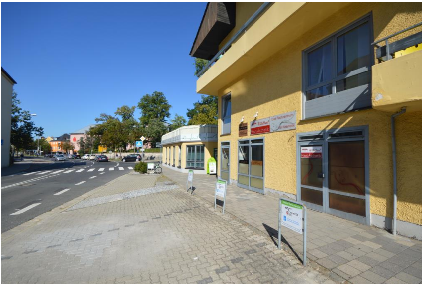
Parken vorm Haus