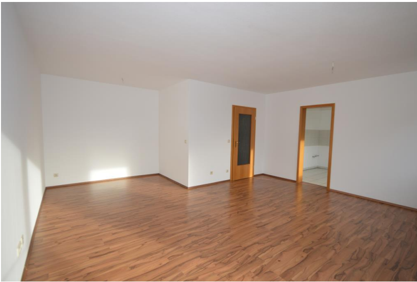
Wohnen & Essen