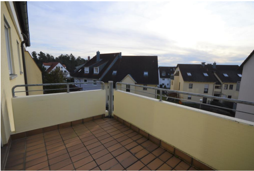
Großzügig nach Südwest