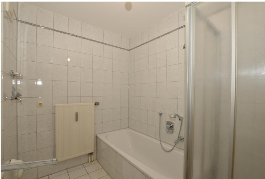
Wanne & Dusche