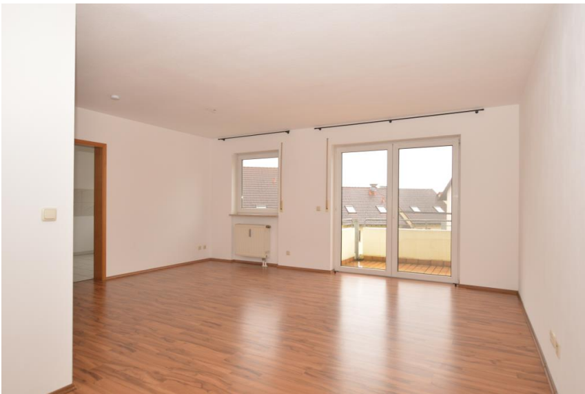
Essplatz nah an der Küche