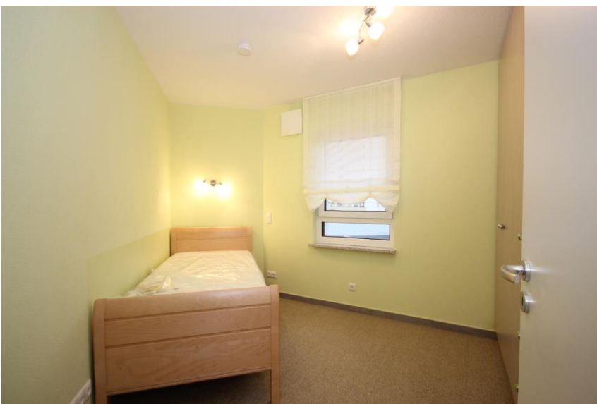
Schlafzimmer mit ...