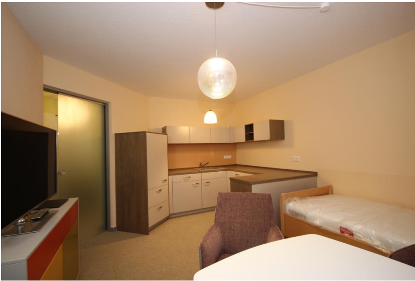
Noch nicht bewohnt