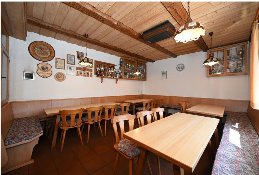
70 Sitzplätze mit Nebenzimmer