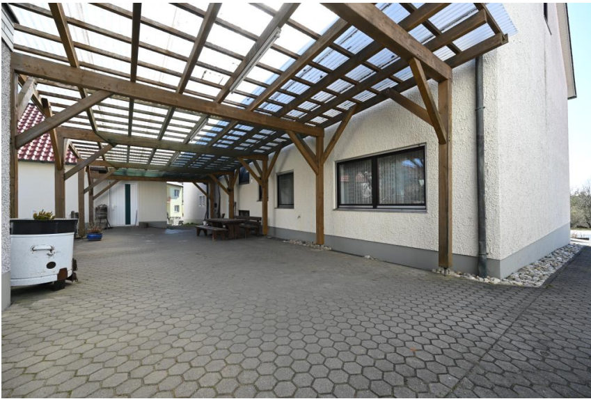
Hinterhof mit Überdachung