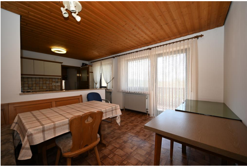
Wohnung 1 im EG ...