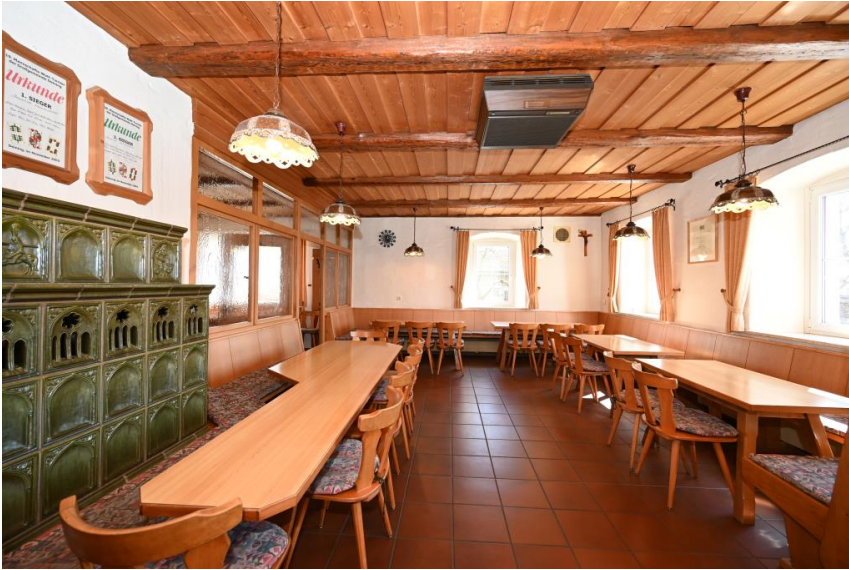
Gasthaus - Komplettausstattung