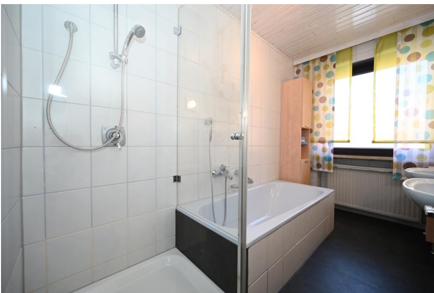
Bad 1 - Vollausstattung