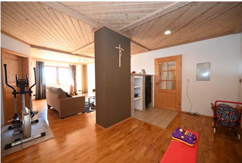
Wohnung 3 - wertige Ausstattung