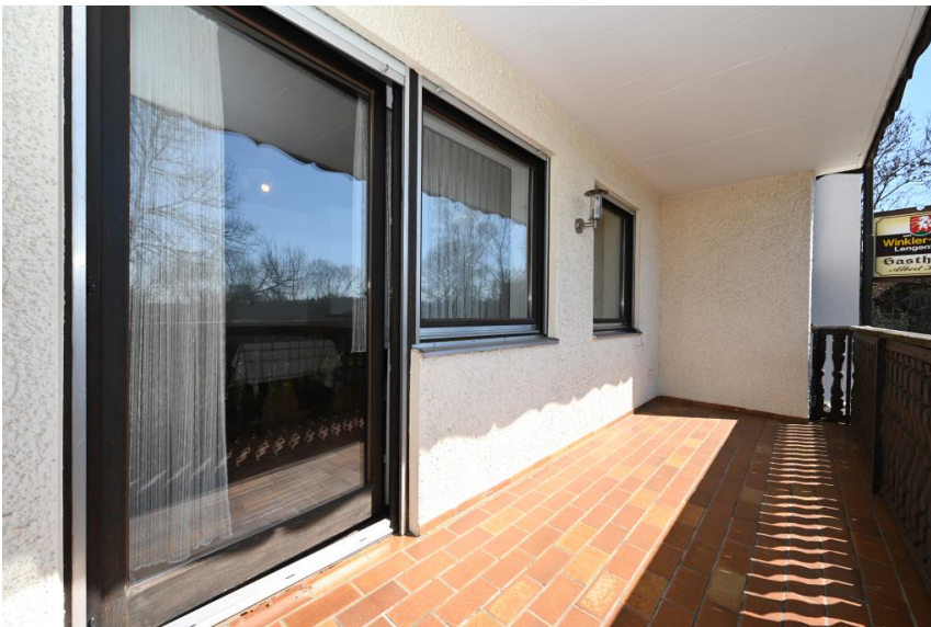
... mit Balkon