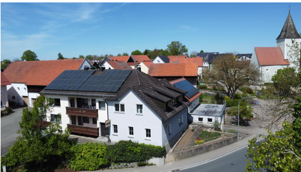
Dominantes Anwesen in Ortsmitte