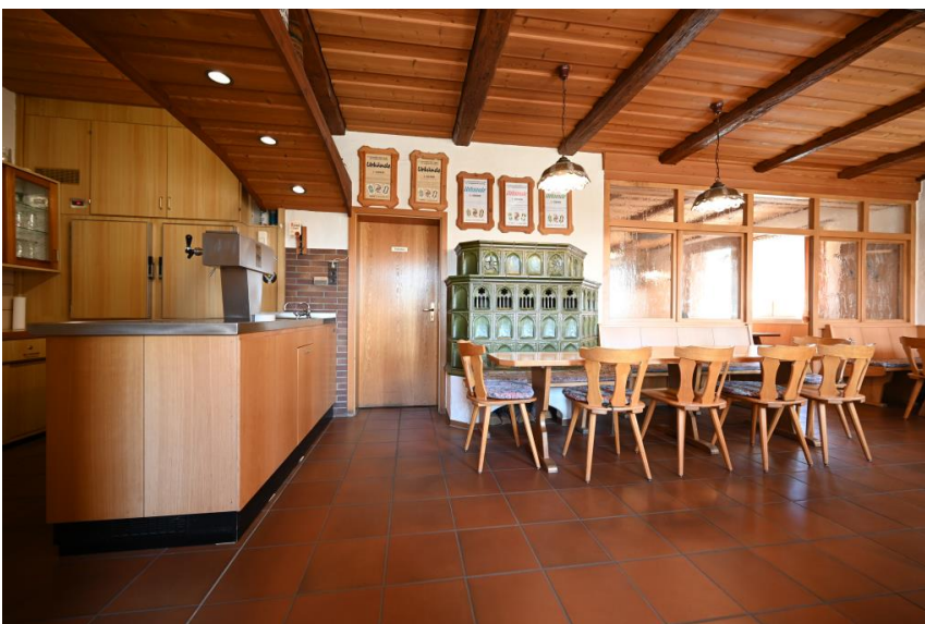
Einladend & gemütlich