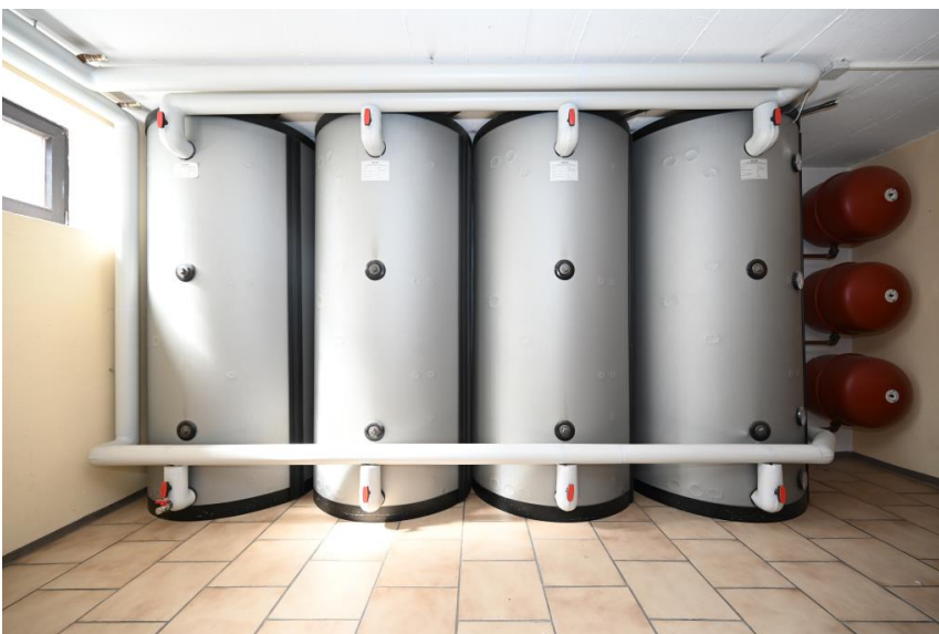
4000 ltr. Puffer-Speicher