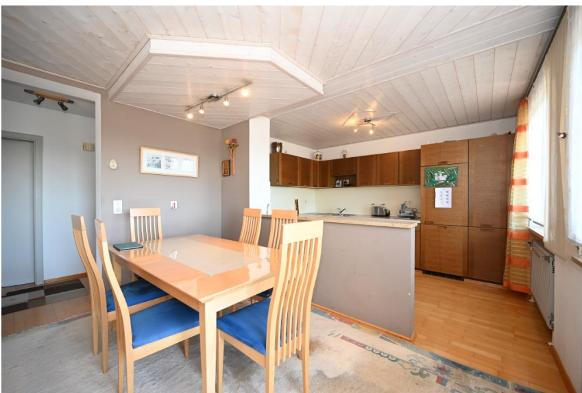
Wohnung 2 im 1.OG