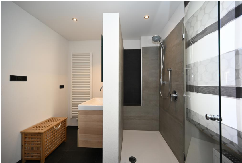
Bad 2 - Wanne & Dusche