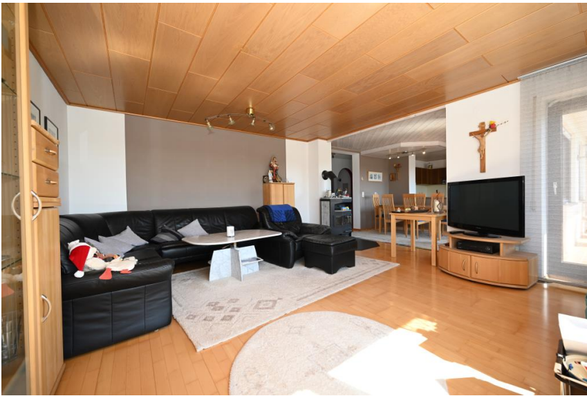
Offenes, großzügiges Wohnen