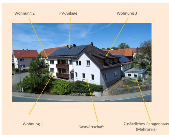
3 Wohnungen & Gasthof & 2 Garagen