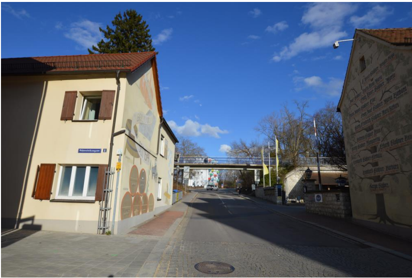
Rosengasse: Inmitten der Altstadt