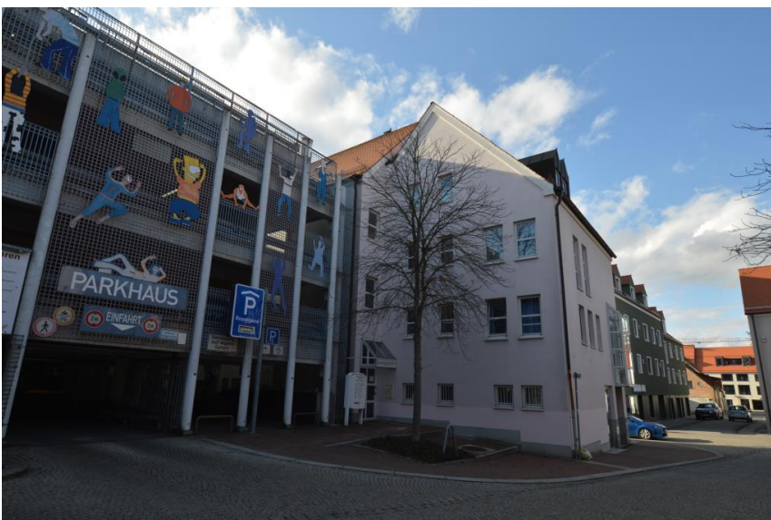
Dauerparken um die Ecke mgl.