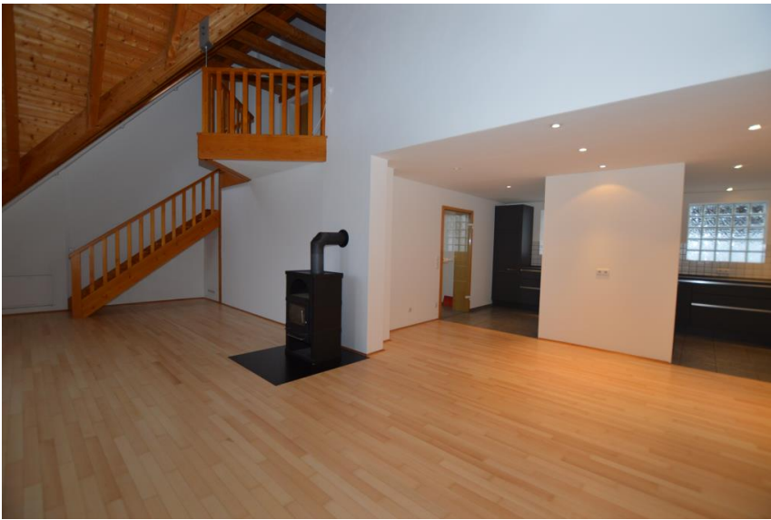
Wohnen über 2 Etagen