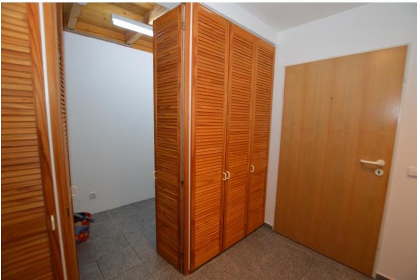
Eingang mit Abstell