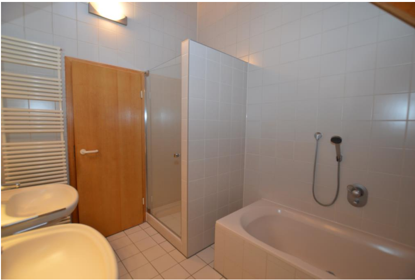
Bad mit Wanne und Dusche