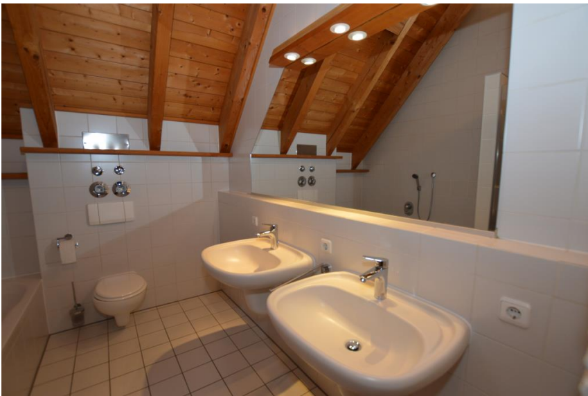
Großzügig + gepflegt