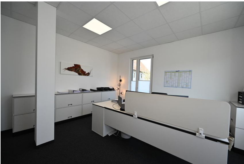
Zur alleinigen Nutzung