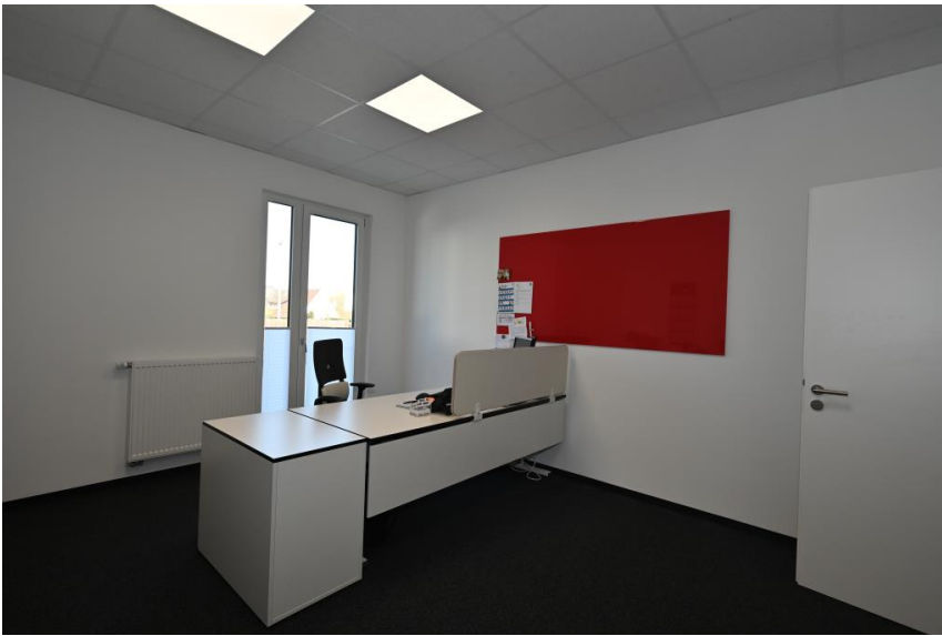
Optional Büro 2