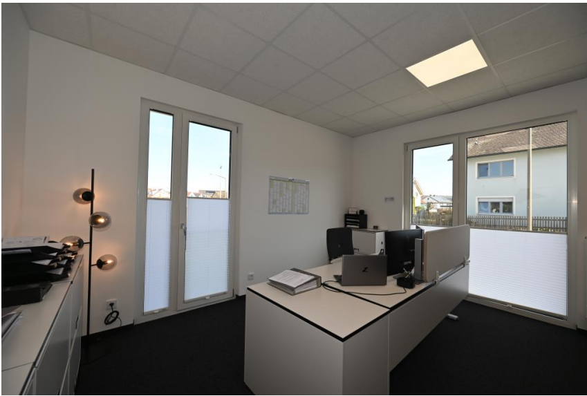
Voll möbliertes Büro