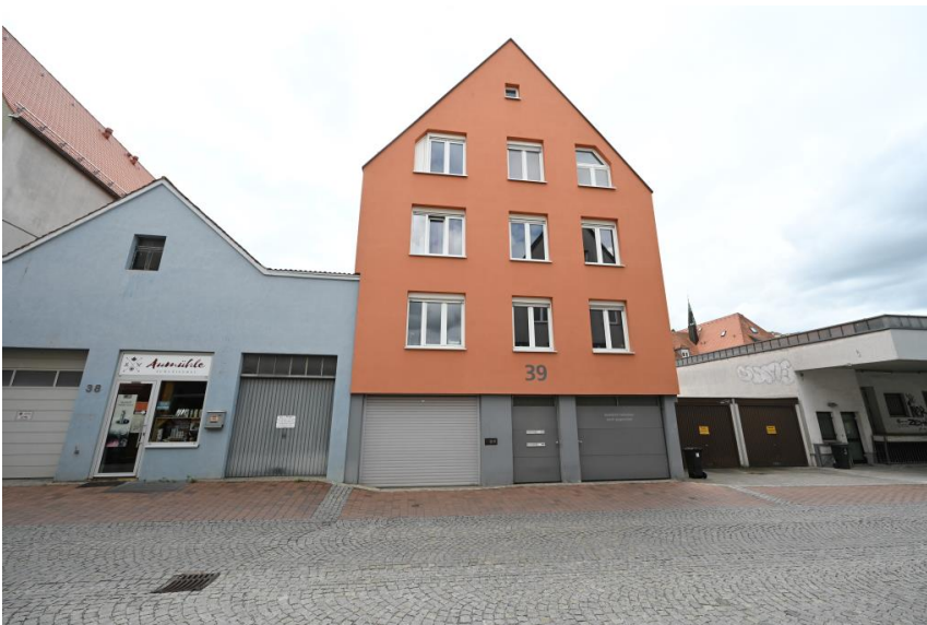
Wohnen in der Altstadt