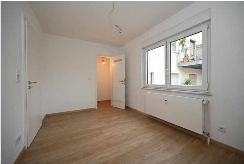
... mit eigener Speisekammer