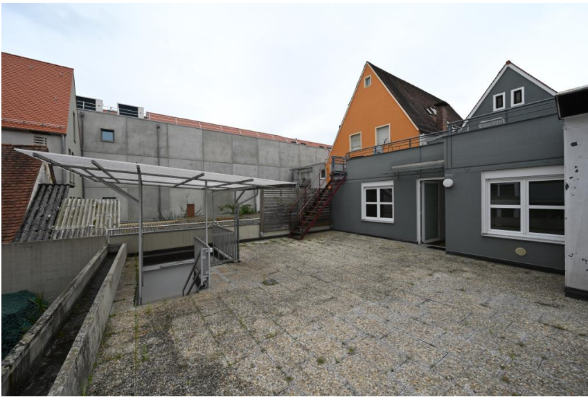
Zugang zur Wohnung