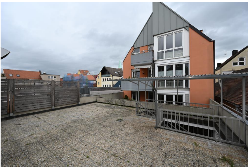
Ruhig & sonnig