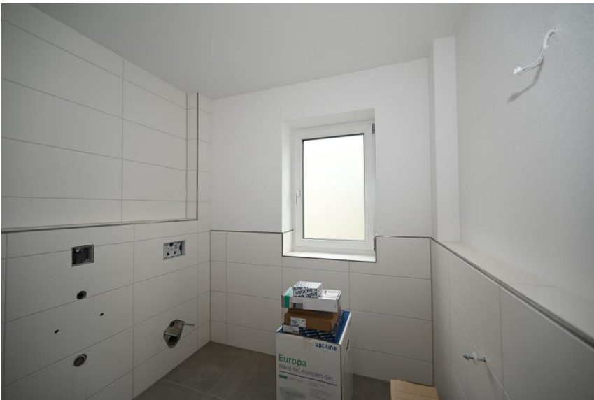
Zeitlos und mit Fenster