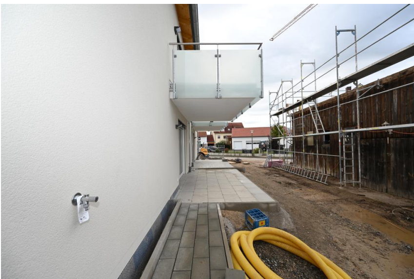
Terrasse nach Südwest