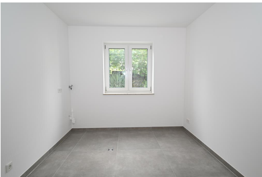
HWR mit WM-Anschluss