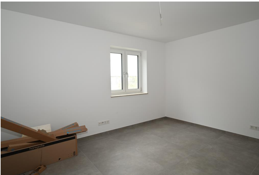
Kind oder Büro