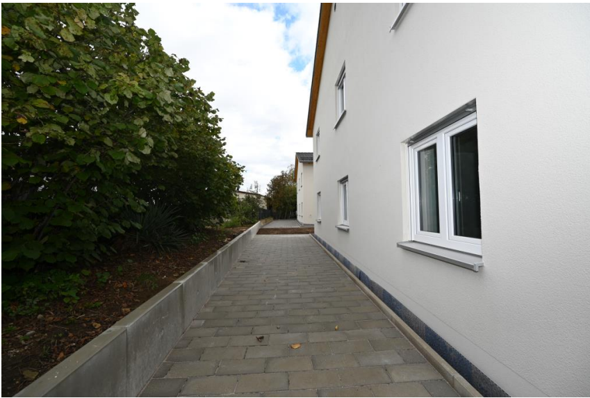
Platz für Gartenhaus