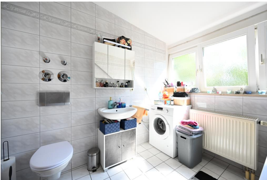
Helles Bad in Volllausstattung