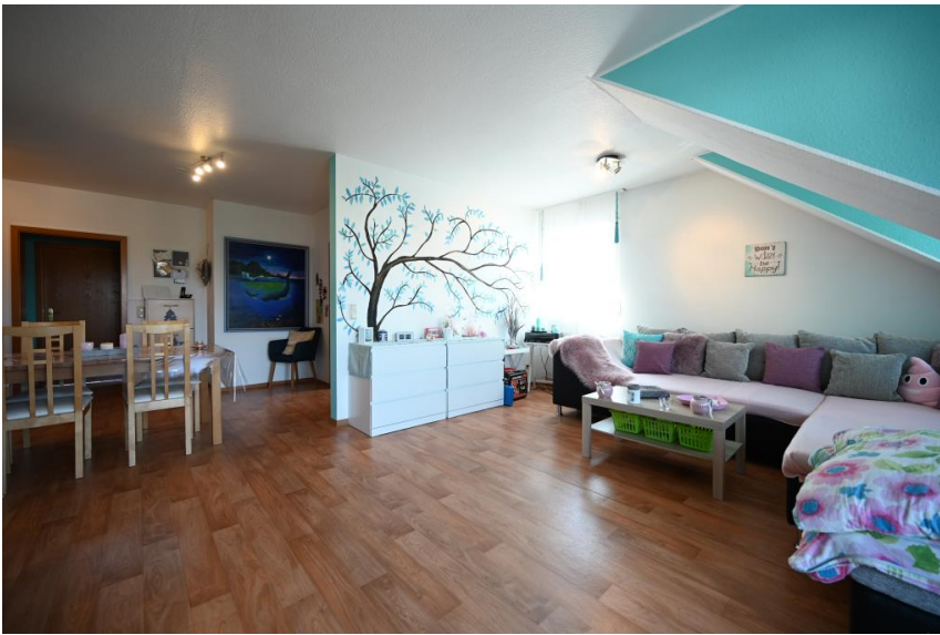
Heller, offener Wohnflair