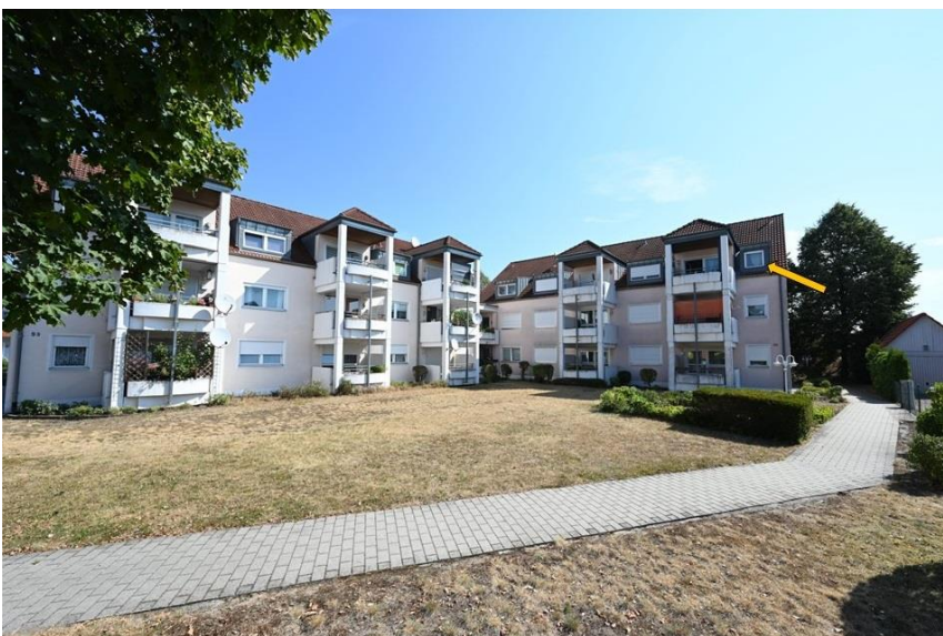
Qualitätsbau Fa. Fuchs