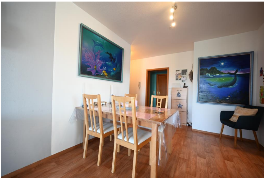
Essplatz nahe der Küche