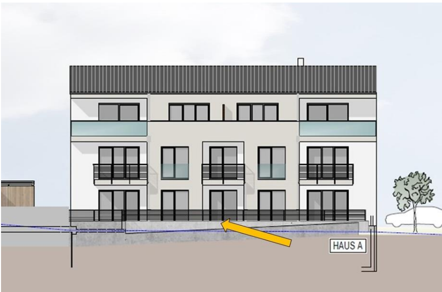
Haus A - Wohnung A02