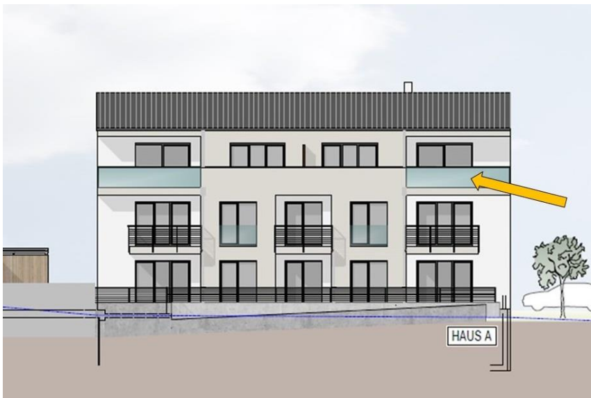
Haus A - Wohnung A07