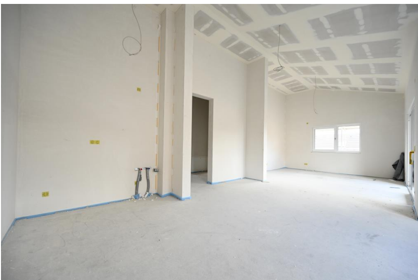
Raum für kreatives