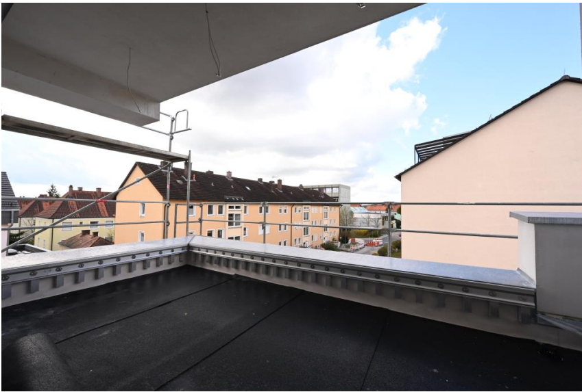
Teilw. überdachte Terrasse