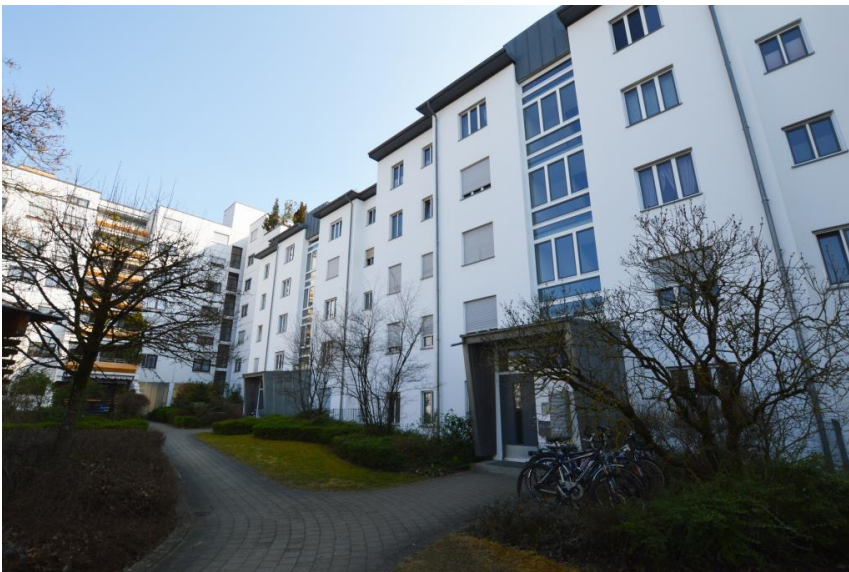
Gefällige Architektur ...