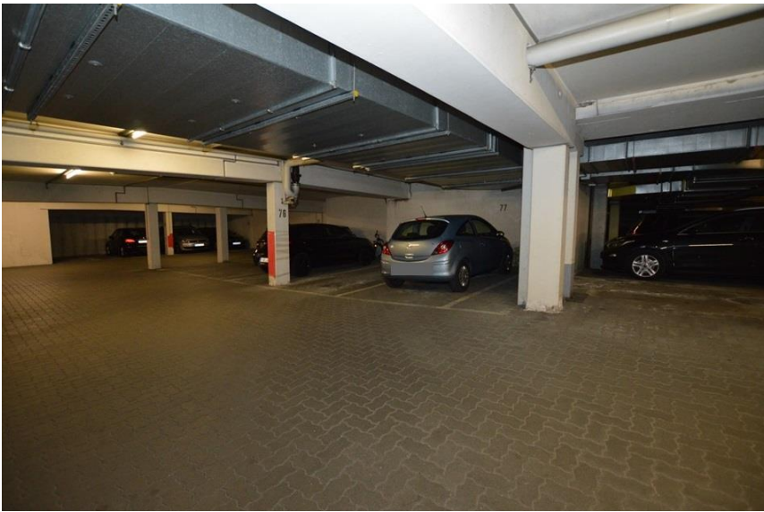
... und TG-Platz