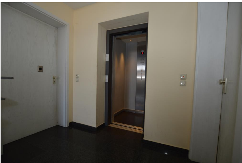
Mit Aufzug ...