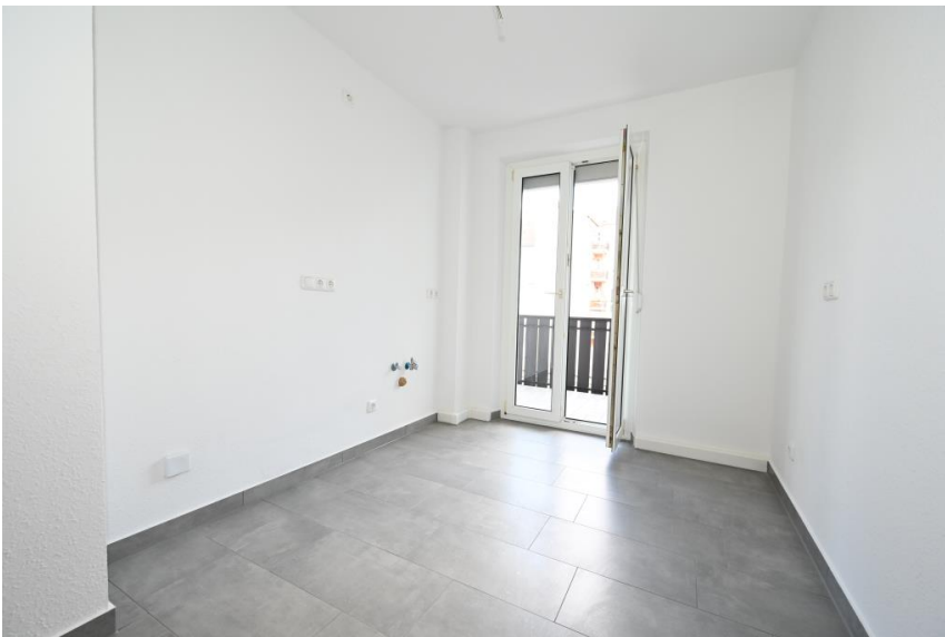
Küche mit Zugang zum Balkon