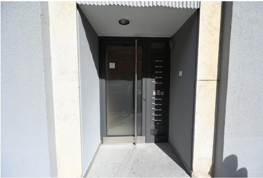
Neu gestalteter Eingangsbereich