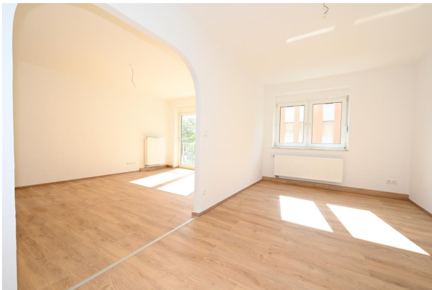
Ess- & Wohnbereich