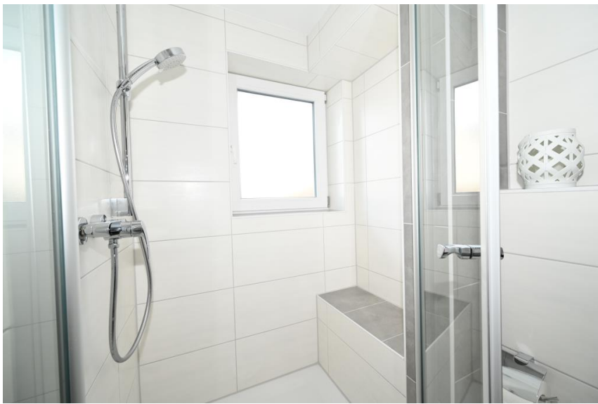
Tolle, neue Dusche