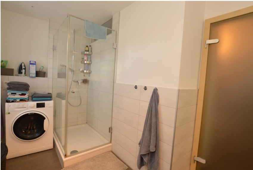
Helles Bad mit ...