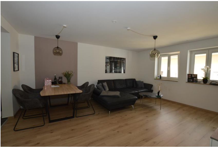
Vinyl- & Fliesenböden