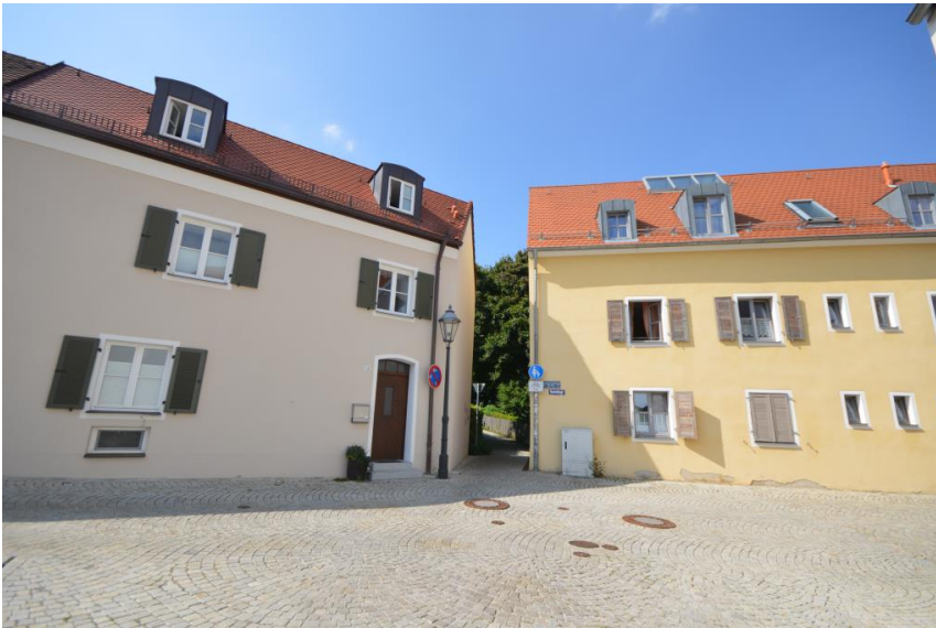
Neumarkt - Rainbügl