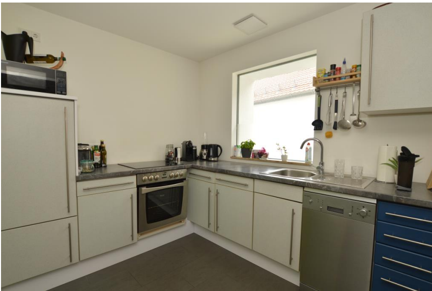
Küche auf Wunsch zur Ablöse