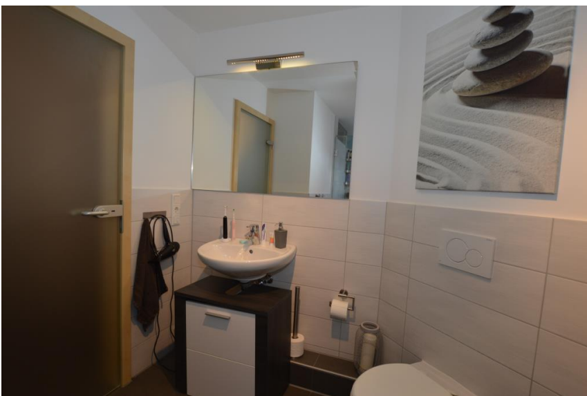
... Dusche, Fenster & WM-Anschluss