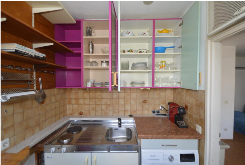
Alles Inventar inklusive