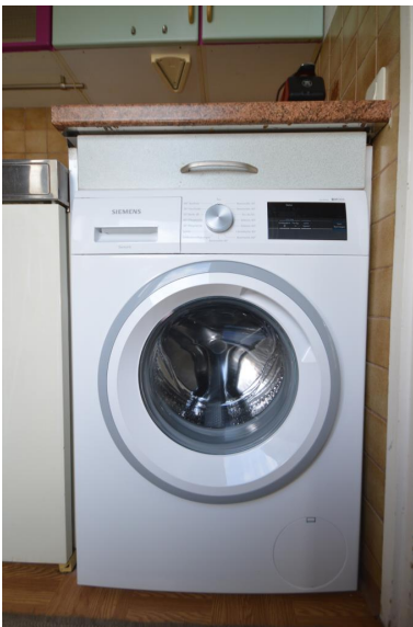
Neue Waschmaschine aus 2020