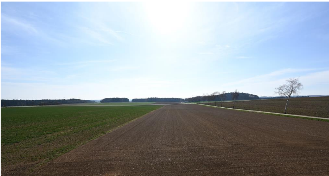
Weitblick über die Felder