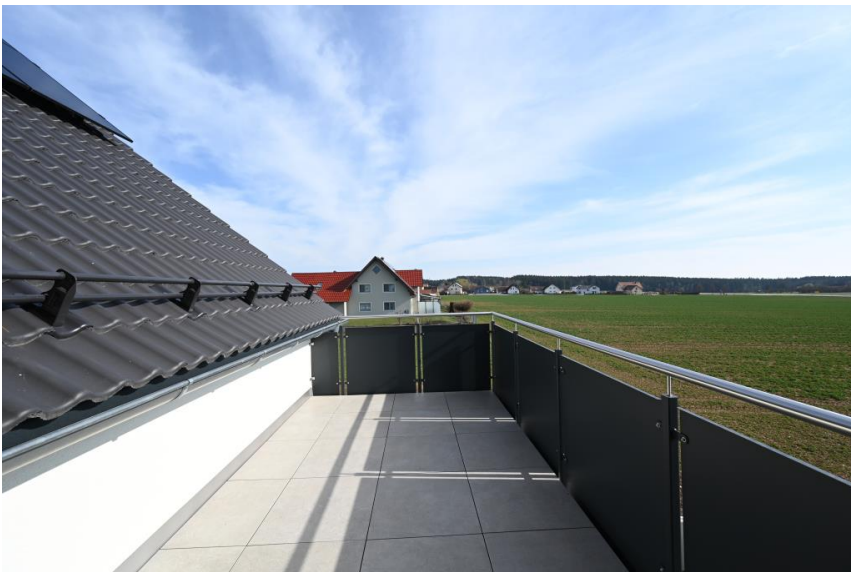
Südbalkon am Ortsrand