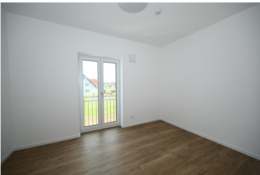
Büro oder Kind