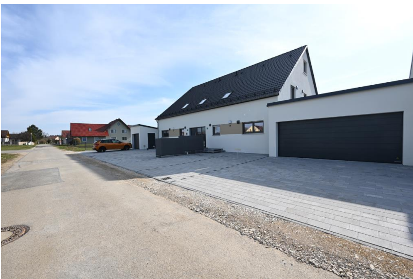
2 PKW-Stellplätze inklusive