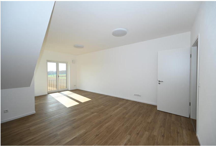
Großzügig und offen