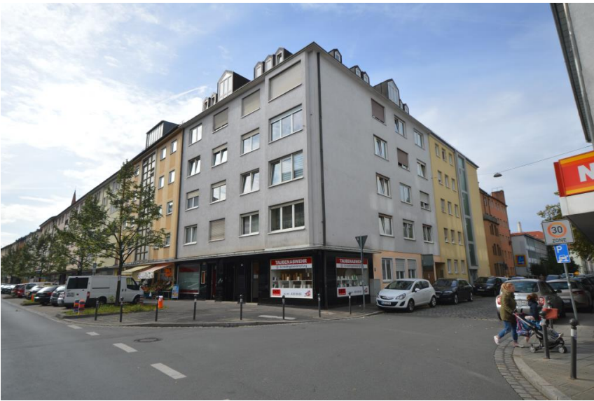
Zentrumslage nahe Opernhaus