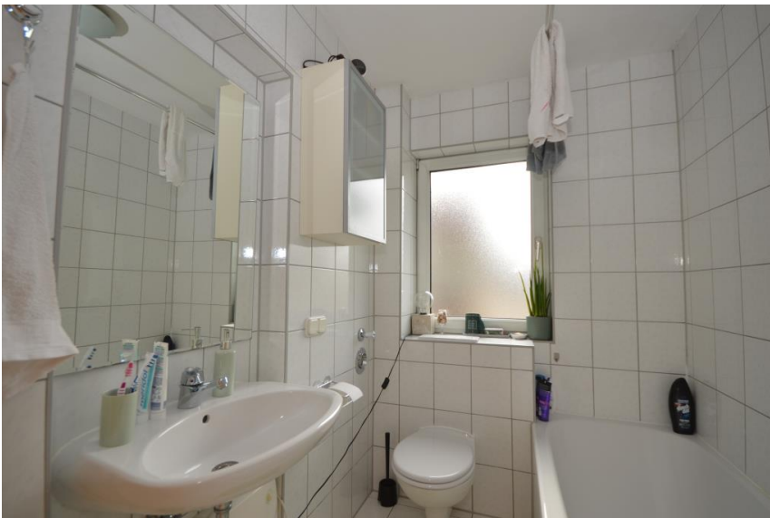
Tageslichtbad mit Wanne