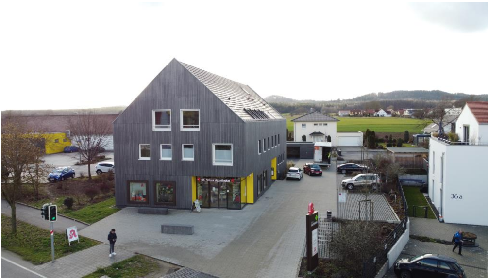
Ärztehaus als Nachbar