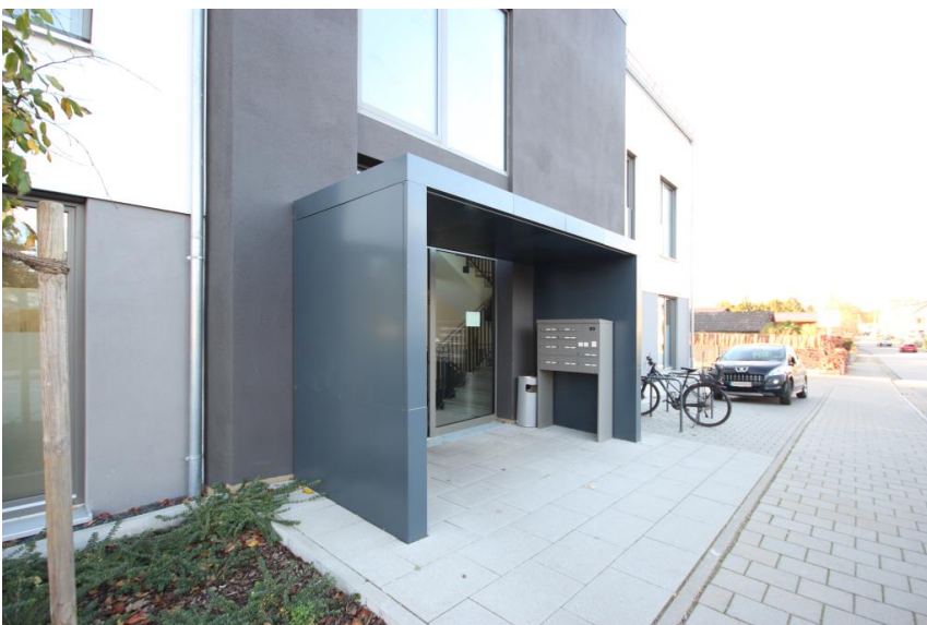
Das Wohn- & Geschäftshaus