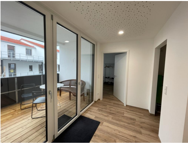
3 Balkone inklusive