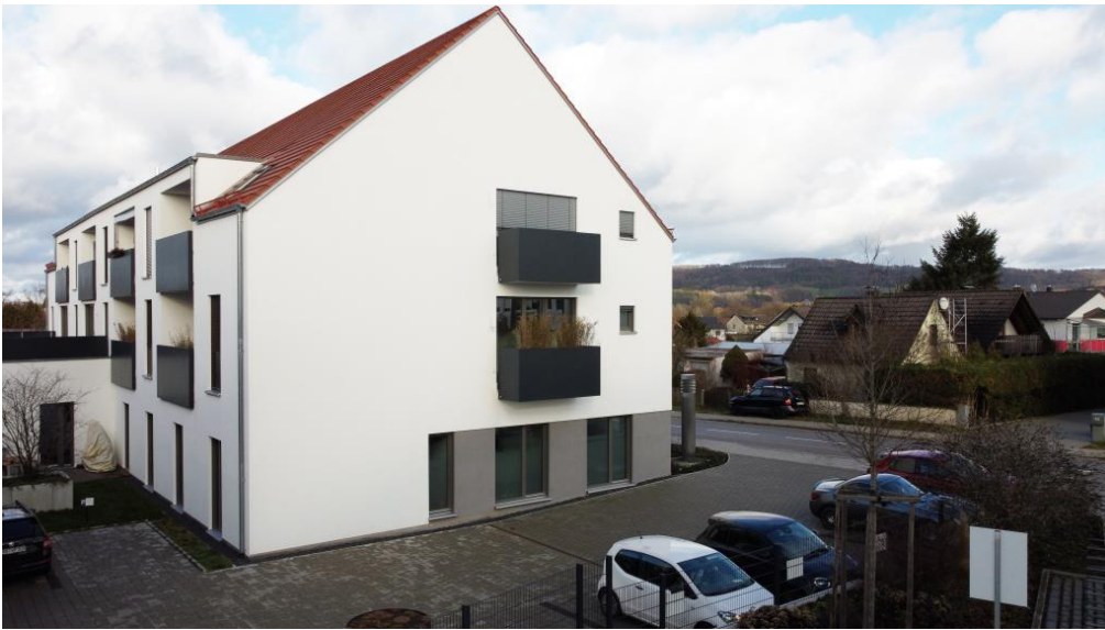
Praxis mit 3 Balkonen