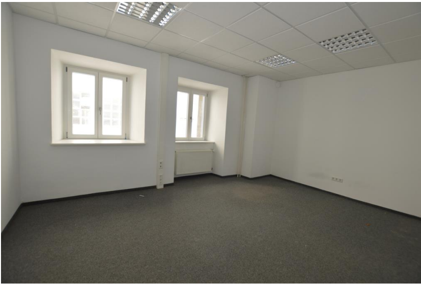
teilweise miteinander verbunden