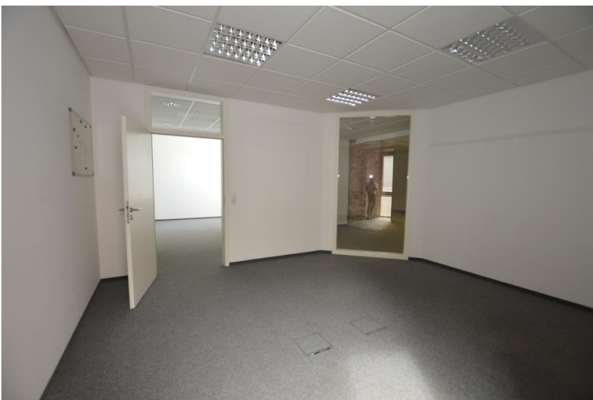
Grundriss tlw. in Trockenbau