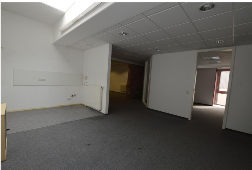
Sozialraum mit Oberlichte