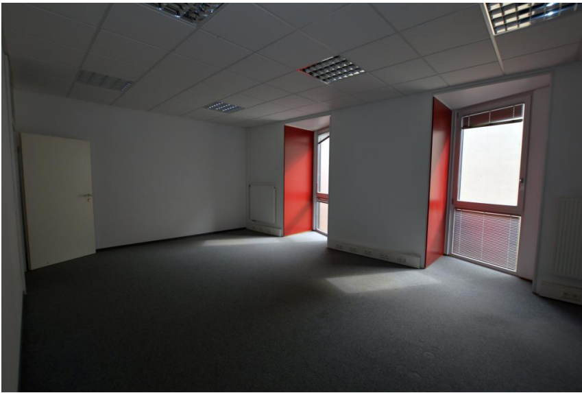
Moderner Anbau 2008